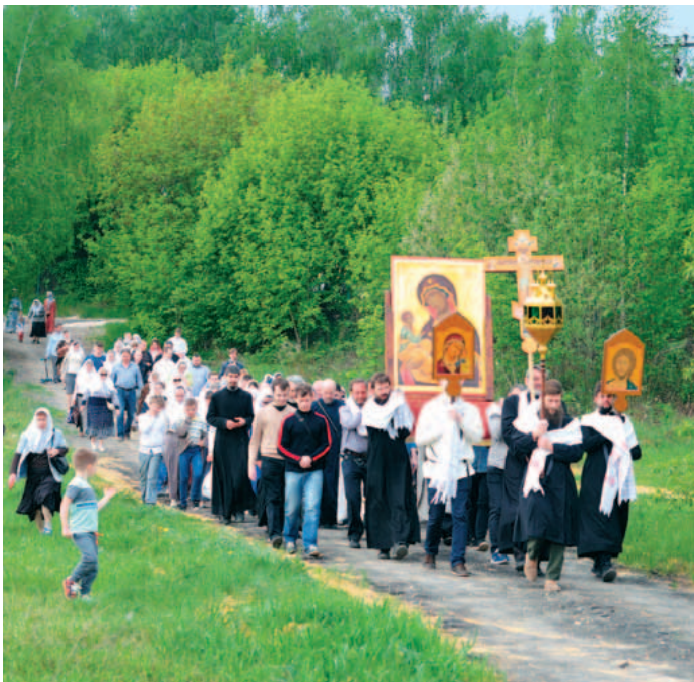
Начало Крестного хода в честь Иерусалимской иконы Пресвятой Богородицы. Фото 12 мая 2019 года