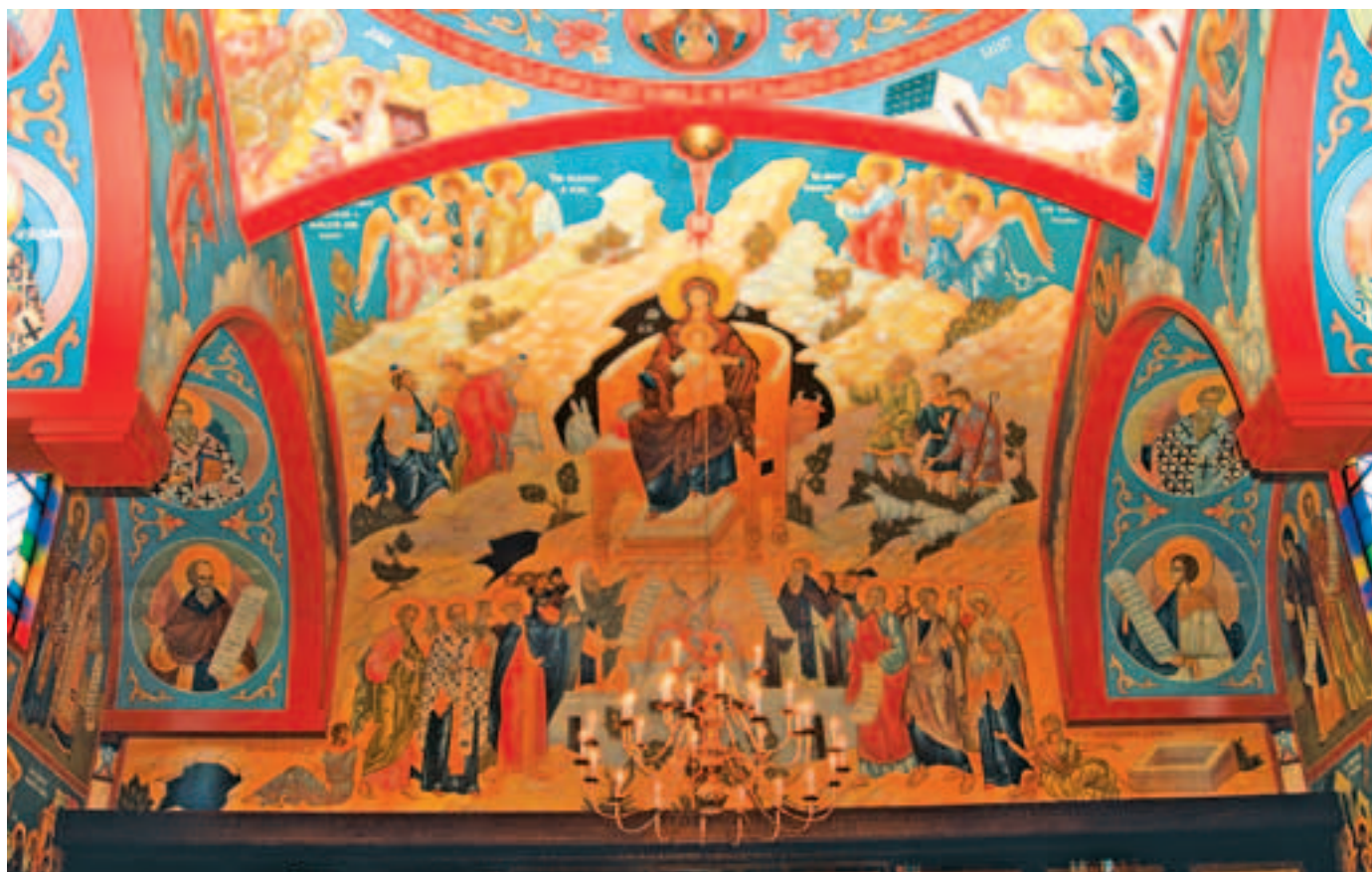
Роспись восточной стены храма Рождества Христова в Ири. Фото 2008 года