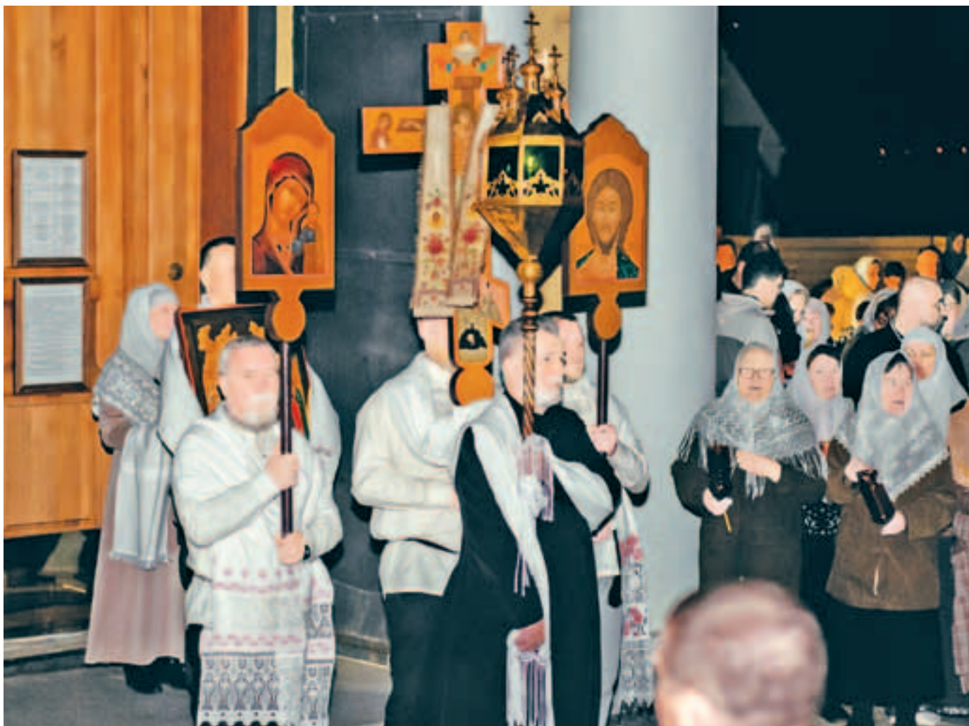
Светлое Воскресение Христово. Полночь 28 апреля 2019 года

В ремя Великого поста пролетело незаметно, но не бесследно. Многие прихожане Михаило-Архангельского храма во время говения Святой Четыредесятницы неоднократно очищали свои души в Таинстве покаяния и принимали Святыне Христовы Тайны в Таинстве Святого Причастия. В дни Страстной седмицы, при воспоминании последних дней земной жизни Господа Иисуса Христа, все события, предшествовавшие Спасительной Крестной Жертве, переживались так глубоко, словно верующие лично созерцали происходившее во Иероса-