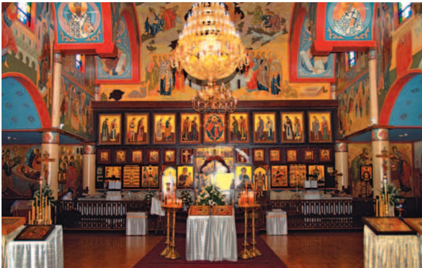
Иконостас храма Рождества Христова в Ири. Фото 2008 года

Царских врат или мы не освящали хлеба на всенощном бдении, то только потому, что это были никонианские добавления в службу. Тогда же я в первый раз осознал, что есть такие моменты в богослужении, которые мы утратили, а никонианине их по-прежнему исполняют.