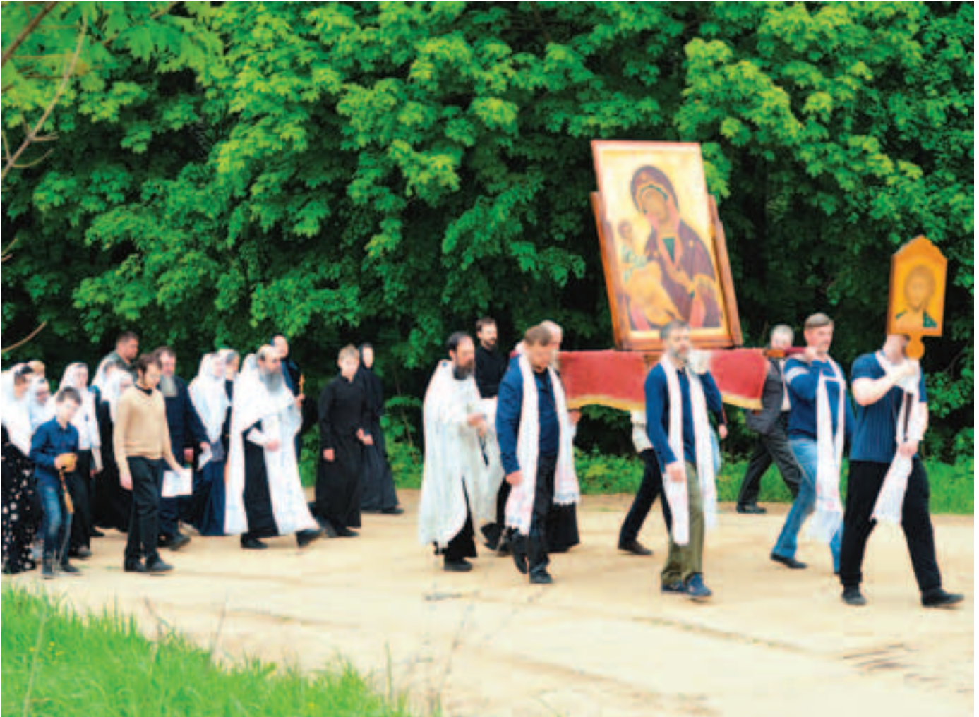
Восхождение на Боровской курган. Фото 12 мая 2019 года

плечах богомольцы, сменяя друг друга в течение долгого пути.