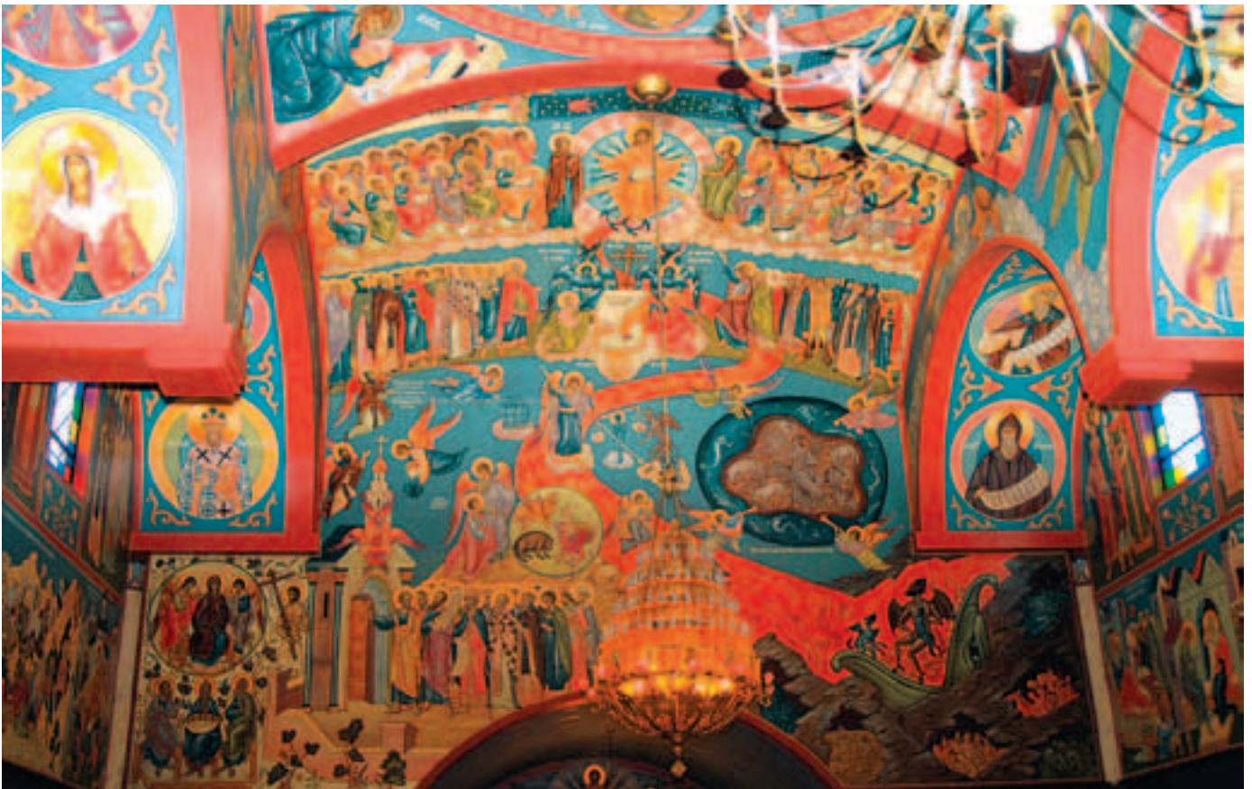
Роспись западной стены храма Рождества Христова в Ири. Фото 2008 года

клятвы на старые обряды, а Русская Православная Церковь за границей сделала то же в 1974 году. Но все другие наставники беспоповцев-поморцев из американских общин рядом с Питсбургом, в Детройте и Нью-Джерси заняли примерно такую позицию: «Замечательно, никониане наконец-то осознали то, что поступали неверно. Поблагодарим их, но останемся в своем прежнем состоянии до тех пор пока не соберем что-то вроде Всемирной старообрядческой конференции». Это было мечтой, фантазией. Через несколько лет я понял, что этого не произойдет и начал размышлять о том, что, возможно, нам надо начинать действовать самостоятельно, ибо мы не могли ждать, пока все остальные соберутся что-либо предпринимать.