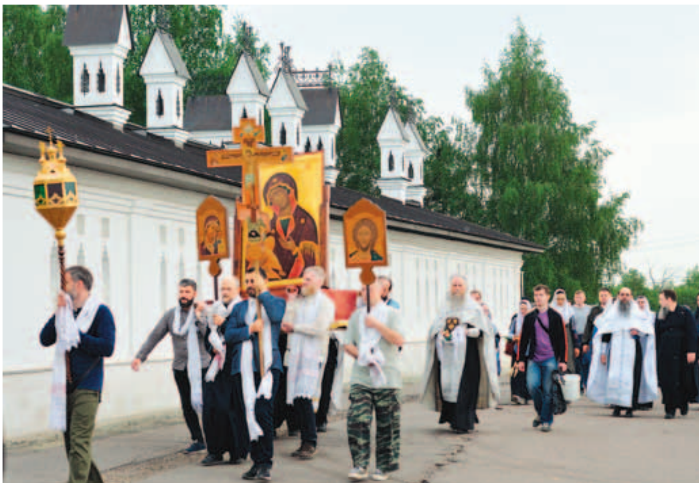
Возвращение в храм. Фото 12 мая 2019 года

но преодолевают длительный непрерывный подъем. За это время оканчивается пение Пасхального канона, и оставшуюся часть пути до самой вершины кургана духовенство и клирошане воспевают тропарь Пасхи. На самой вершине кургана оканчивается молебен Светлому Воскресению Христову, после отпуска и целования креста богомольцы с пением Пасхальных песнопений начинают непростой спуск к источнику, расположенному на западном склоне кургана.