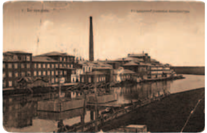
Глуховская мануфактура в г. Богородске Фото начала XX века