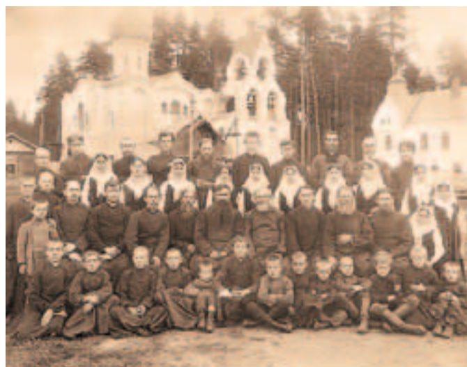
Морозовский хор Фото начала XX века

Однажды с ребятами нашей Толстовской улицы мы были за Шелаевским разбездом около кладбища, вдоль которого проходило Владимирское шоссе. Вдруг мы видим со стороны Успенского большое облако пыли, приближавшееся к нам. Это нас страшно заинтересовало и мы решили подождать, когда это облако догонит нас. Долго мы не ждали. Нас догнала большая толпа людей. В основном это были крестьяне, одетые в лаптях и длинных рубахах. В этой толпе мы увидели, что несколько