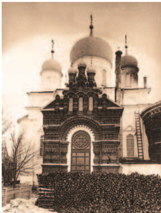
Тихвинский храм. Фото начала XX века

Среди жителей дореволюционного Богородска было немало старообрядцев. Они относились к Иерусалимской иконе Богоматери с большим почтением и всегда приходили поклониться ей, когда крестный ход с иконой приходил в Богородск.