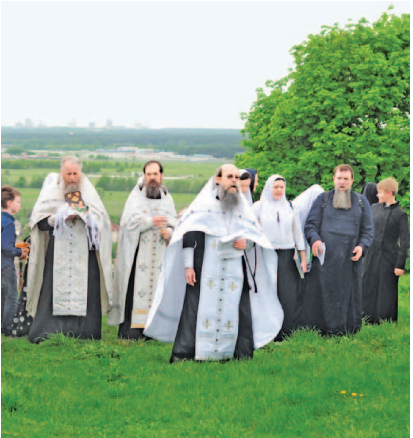
На вершине кургана. Фото 12 мая 2019 года

богомолья остается неизменной — освятить всех и все молитвой и несомой Святыней.