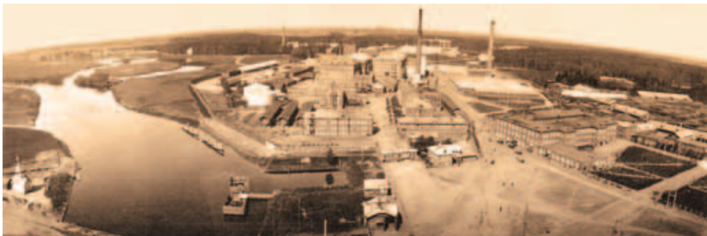
Богородск. Фото второй половины XX века