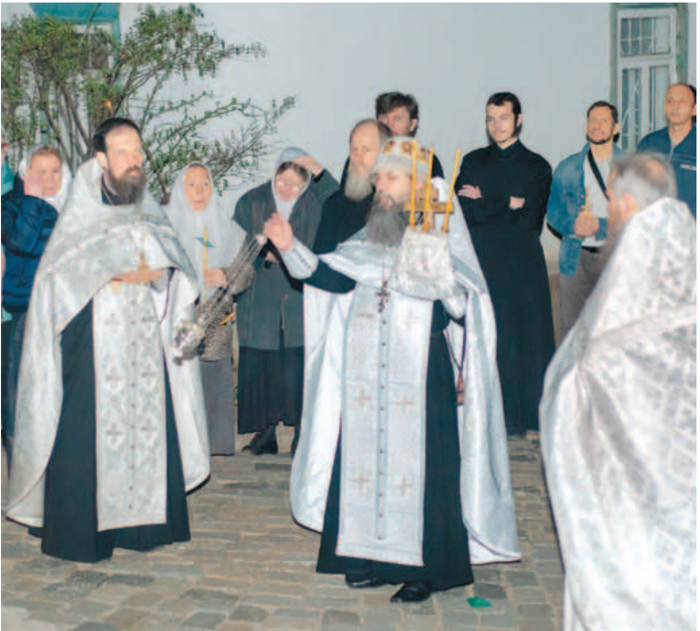
Священноархимандрит Иринарх запевает тропарь Пасхи. Полночь 28 апреля 2019 года

нуть слова Пасхального канона: «Вчера распинахтися Христе, вчера спогребохтися, совостаю днесь совоскресшу Ти, Сам мя прослави Спасе во Царствии Своем».