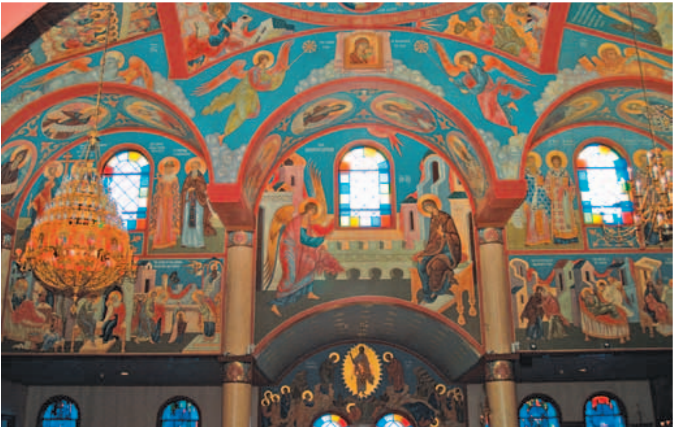
Роспись северной стены храма Рождества Христова в Ири. Фото 2008 года

нужно двигаться дальше, но еще не осознавая, куда идти.