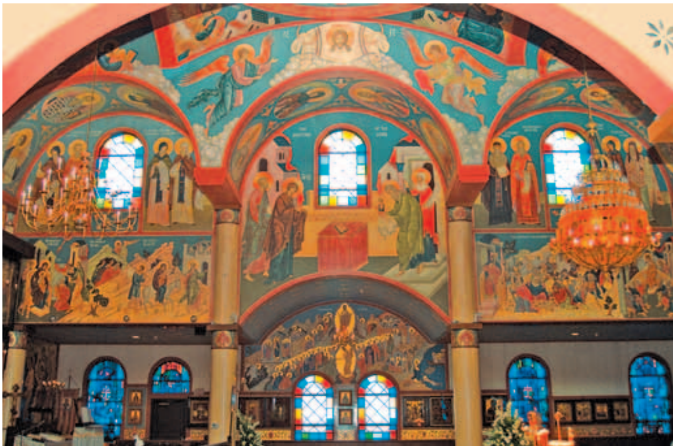
Роспись южной стены храма Рождества Христова в Ири. Фото 2008 года