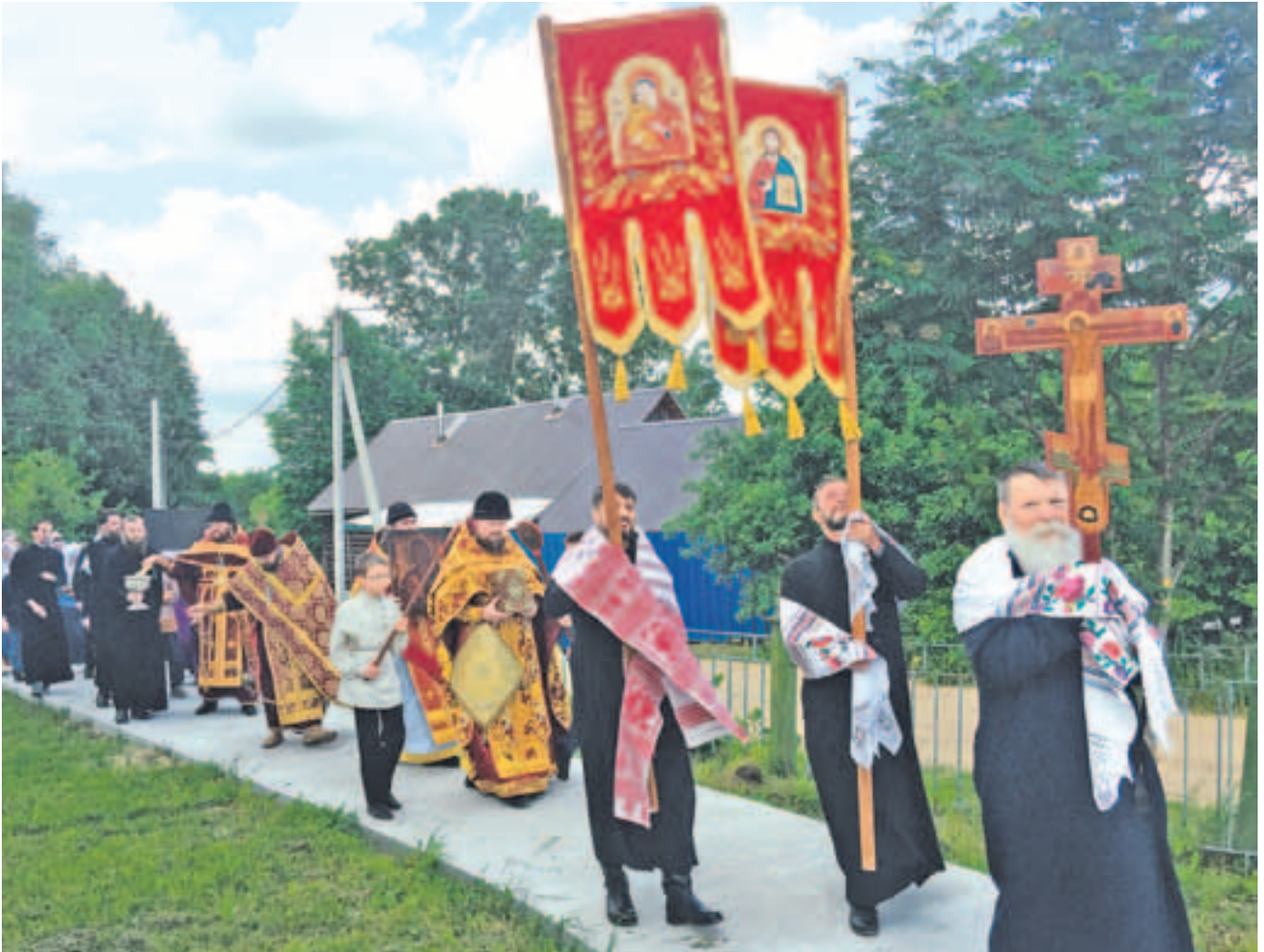
Праздничный крестный ход. Фото 3 июня 2019 года

тия, во время седьмой и восьмой песен канон был совершен праздничный крестный ход вокруг церкви. При этом отец настоятель кропил освященной водой стены храма.