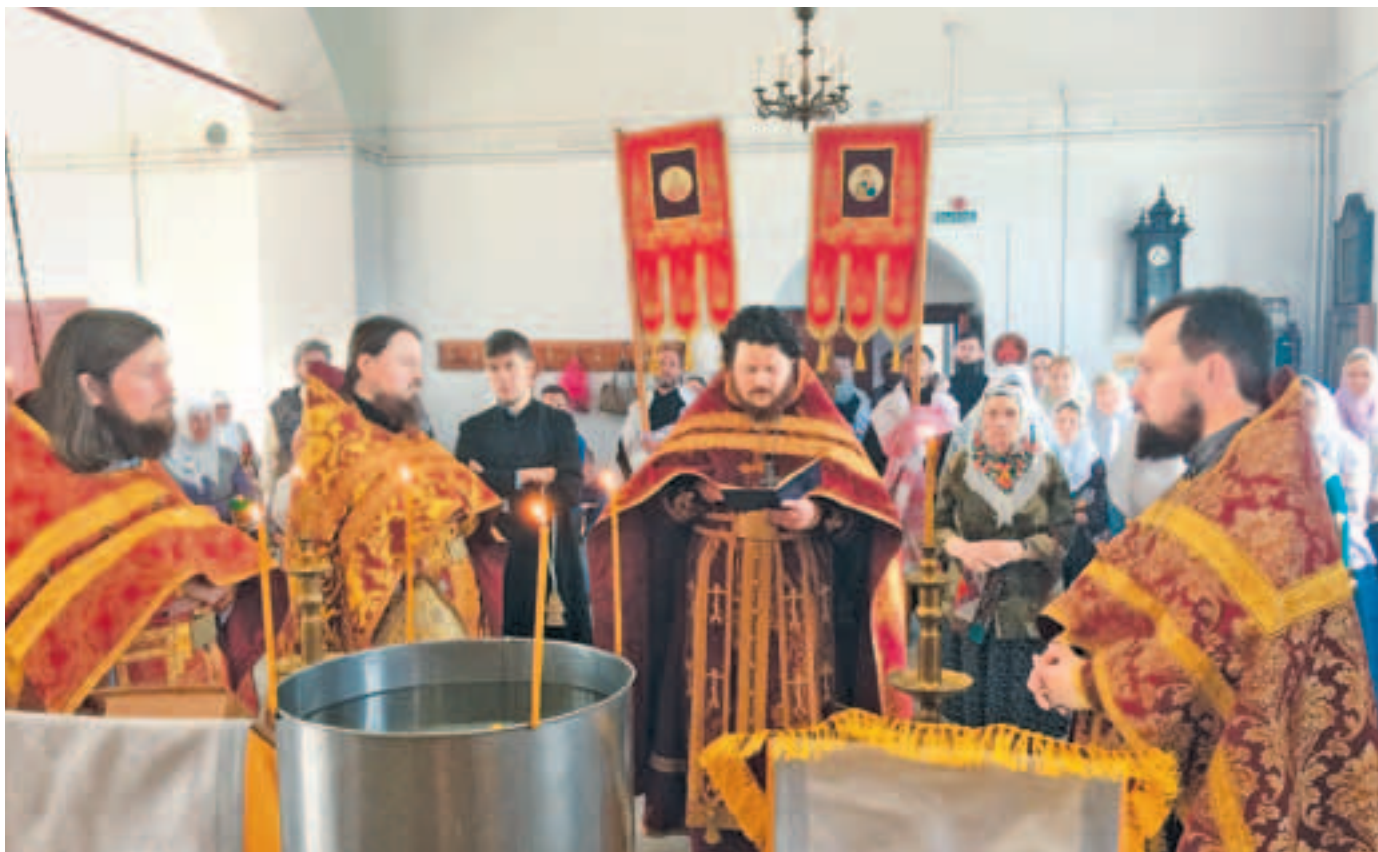
Водосвятный молебен на праздник Владимирской иконы Пресвятой Богородицы. Фото 3 июня 2019 года

21 мая / 3 июня 2019 года в единоверческом храме села Осташово прошли торжества по случаю престольного праздника – Сретения Владимирской иконы Божией Матери.