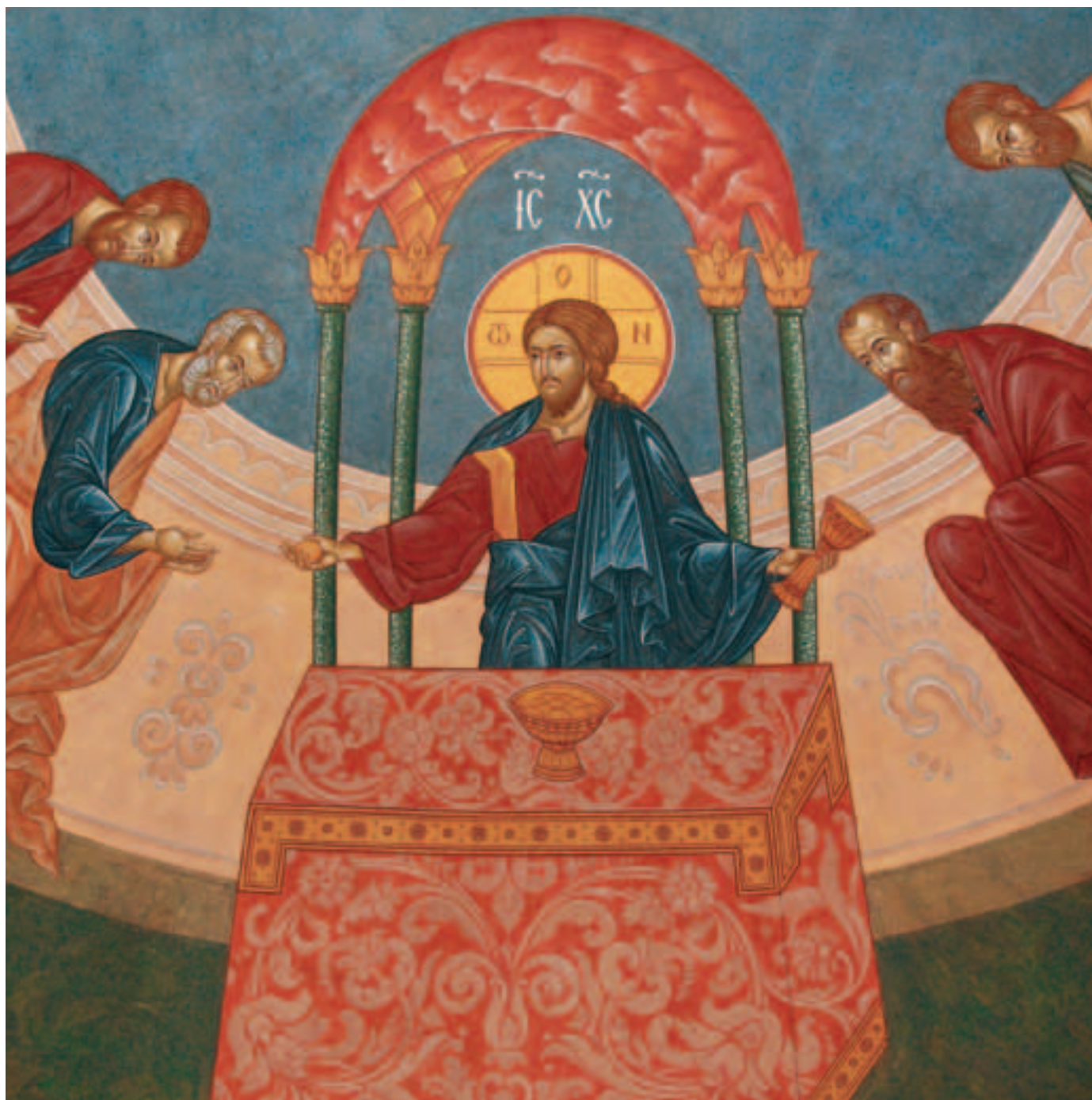
Причащение святых апостолов. Роспись алтаря единоверческого храма Архангела Михаила. Фото 2011 года