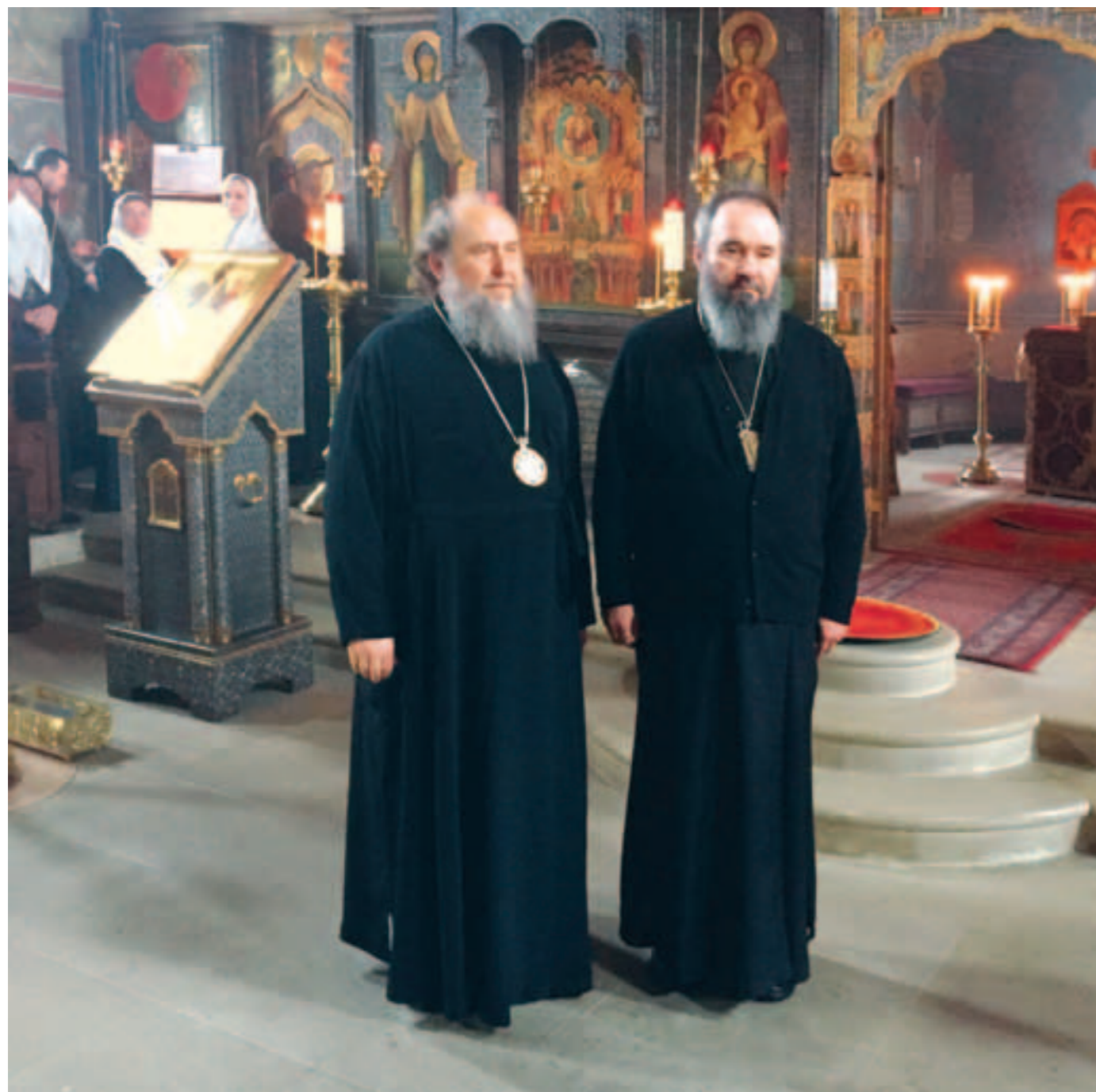
Митрополит Астанайский и Казахстанский Александр (слева) и архиепископ Элистинский и Калмыцкий Юстиниан. Фото 25 февраля 2019 года

в храм, где хор исполнил песнопения «Достойно есть», храмовую стихеру «Безплотнии Ангели» и Евангельскую стихеру четвертого гласа. В это время иерархи проследовали во святой алтарь и поклонились местным святыням.