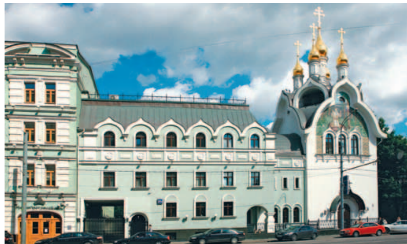
Храм подворья Дивеевского монастыря в Москве на Проспекте Мира. Построен по проекту О.Р. Протоповича

Олег Рюрикович принимал участие в реконструкции колокольни «Русская свеча» Елеонского Спасо-Вознесенского монастыря