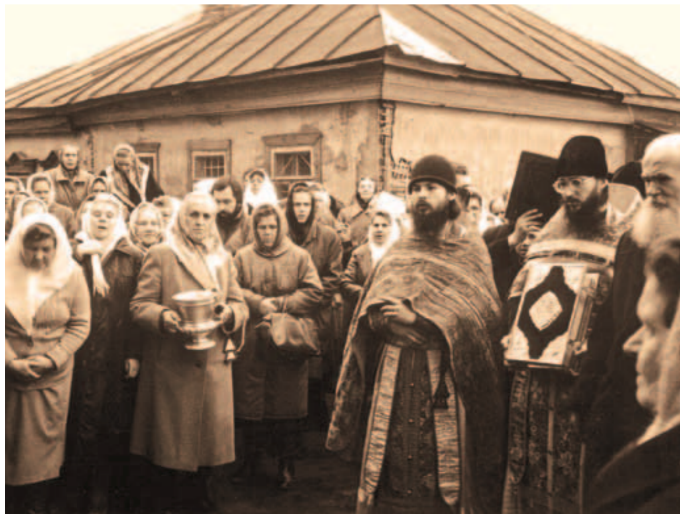
Престольный праздник храма Архангела Михаила Фото начала 1990-х годов

1988 — орден князя Владимира III степени 2000 — орден князя Даниила Московского III степени 2005 — орден преподобного Сергия Радонежского III степени 2006 — медаль святого первоверховного апостола Петра 2008 — медаль «1020 лет Крещения Руси» 2009 — орден преподобного Андрея Рублева III степени 2012 — медаль «В память 200-летия победы в Отечественной войне 1812 года» 2015 — орден преподобного Серафима Саровского III степени 2016 — медаль «За усердное служение» I степени