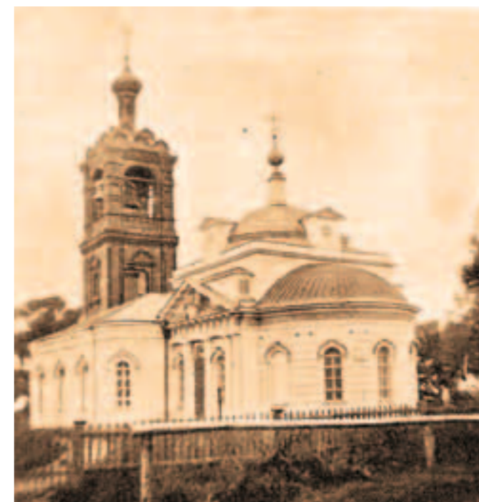
Храм Архангела Михаила погоста Дорков Бронницкого уезда. Фото начала XX века