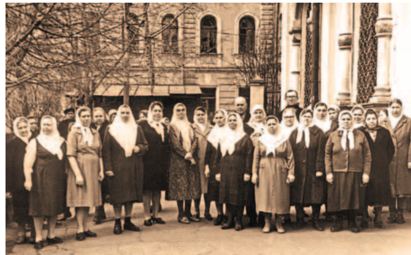
Члены единоверческой общины Никольского храма при Рогожском кладбище Фото конца 1970-х годов

Не так давно, осенью 2017 года, к двухсотлетию юбилею учреждения единоверия в Михайловской Слободе была издана