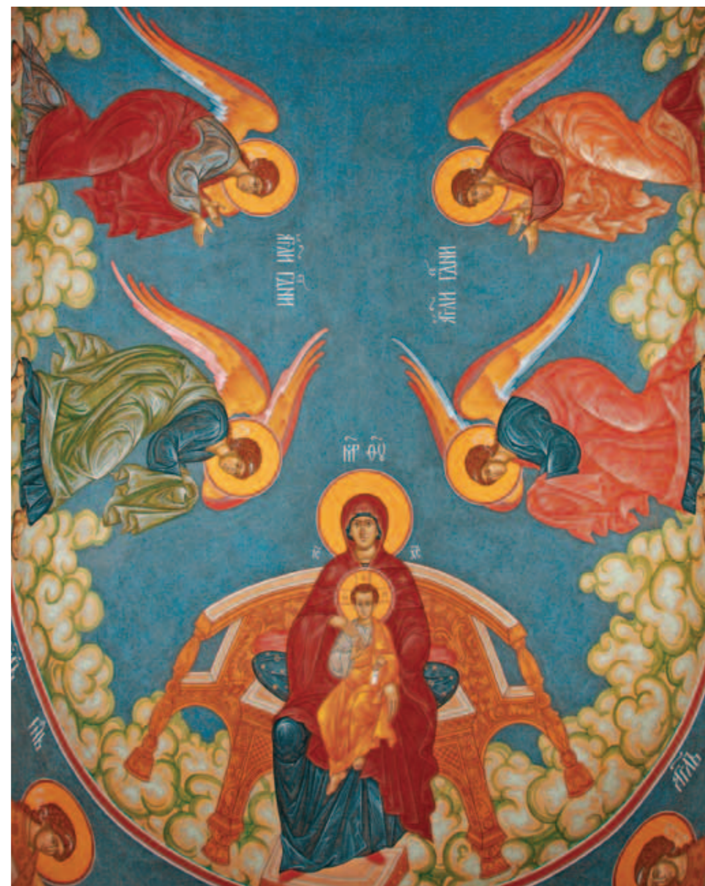
...Окрест предстоят Ему Пречистая Матерь Божия, лики безплотных и чины святых Его Роспись алтаря единоверческого храма Архангела Михаила. Фото 2011 года

Благовестуй земле радость велию, — воскликни, брат мой, и осени себя крестным знаменем, когда слышишь благовест, призывающий тебя к Божественной литургии. Спеши скорее в дом Господень и здесь ты увидишь священников служителей Его, одетых во вся священная, со страхом приступающим к дивному вертепу — святому жертвеннику. Размысли и подивись несказанному таинству. Безначальный начинается, Слово воплощается, и Святой Агнец полагается за грехи всего мира. Окрест предстоят Ему Пречистая Матерь Божия, лики безплотных и чины святых Его. К подножию Агнца возносит иерей молитвы о здравии и о спасении нас грешных и оставлении грехов скончавшихся в вере и о надежде воскресения Его. Принеси и ты, брат