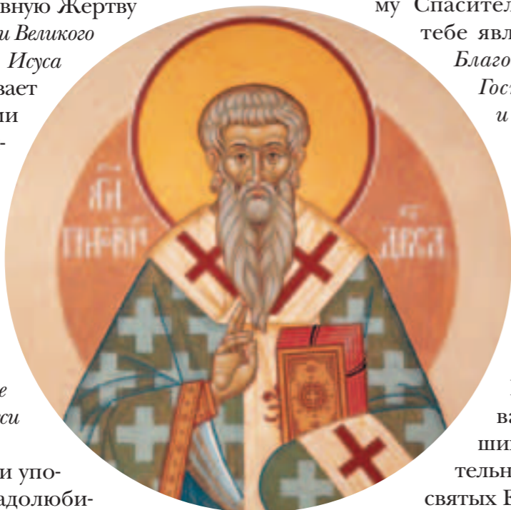
Святитель Григорий Двоеслов — составитель литургии Преждеосвященных Даров. Ростись алтаря единоверческого храма Архангела Михаила. Фото 2011 года

Вот с такими мыслями, возлюбленный брат мой, ты должен присутствовать за Божественной литургией, которая полна такого глубокого и назидательного для тебя смысла. Стой убо со страхом, очи сердечнии горё имея, ко Спасу вопиющи, утверди мя и вразуми мя, Боже щедрый, во спасе Твоем! Аминь.