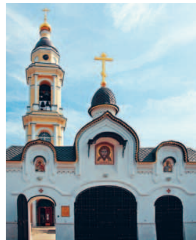
Вверху: вход на территорию храма Архангела Михаила. Фото 1989 года (слева), фото 2017 года (справа) Внизу: южный фасад храма Архангела Михаила. Фото 1989 года (слева), фото 2017 года (справа)