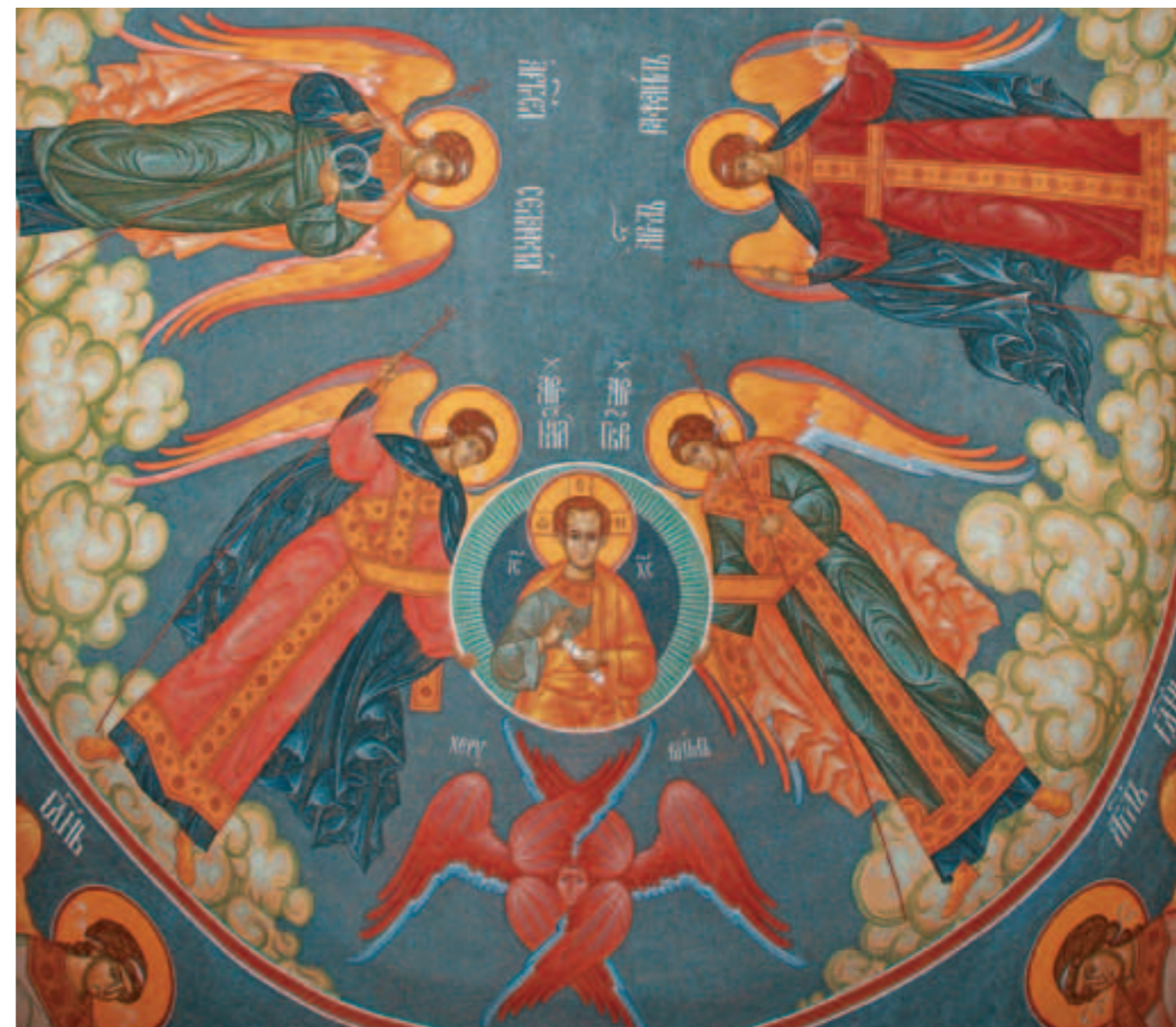
Святые Ангелы вопиют Ему: «Святыи Боже, Святыи Крепкии, Святыи Безсмертныи, помилуй нас» Роспись алтаря единоверческого храма Архангела Михаила. Фото 2011 года

Иже Херувими тайно образующе, — торжественно возглашает клирос от лица всей Церкви! Содрогнись, брат мой возлюбленный, содрогнись, ибо ты с сонмами святых Ангелов становишься участником непостижимого таинства! Царь Царствующих и Господь Господствующих грядет заклатися