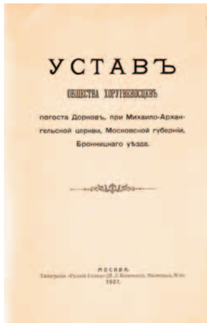
Устав Общества хоругвеносцев храма Архангела Михаила погоста Дорков Бронницкого уезда

Я родился и до самого принятия священства жил все в Бронницком уезде, и еще с детства помню эти ношения чудотворной Иерусалимской иконы Божией Матери, а состоя в течение почти 30 лет священником в погосте Михаило-Архангельском — Дорках, я ежегодно провожал святую икону сию в город, всякий раз относимую (по очереди служения) моими дорковскими прихожанами и всегда накануне 10-го воскресения, и всякий раз воочию убеждался, в каком громадном множестве стекался сюда со всех сторон народ на поклонение св[ятой] иконе Владычицы (в 1-й раз летом возвращающейся в город после долгого из него отсутствия). Когда же при Михаило-Архангельской, в погосте Дорках, церкви (в 1886 г.) было открыто второе священническое