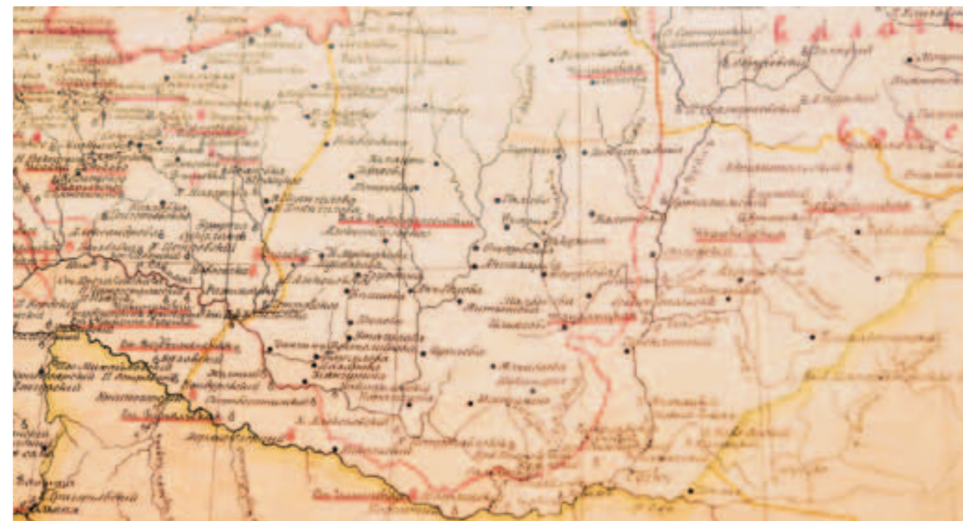
Фрагмент карты Оренбургской епархии конца XIX — начала XX века

Про одну такую неудавшуюся попытку они тут же и рассказали. В одно время они в количестве семей пятидесяти на возах переправились через китайскую границу. Китайские власти приняли их в высшей степени радушно, отвели землю на восточном берегу моря. Однажды в ближайшем городе человек двадцать из них, будучи в нетрезвом виде, забрались в китайскую лавку и разграбили ее. Виновников арестовали, а остальных выселили за границу. На дороге встретились им три китайца, которые брались показать в Китае громадные русские поселения с многочисленными церквами. В награду себе за это просили всего по одному ружью. Бухтарминцы ружья пожалели и не воспользовались