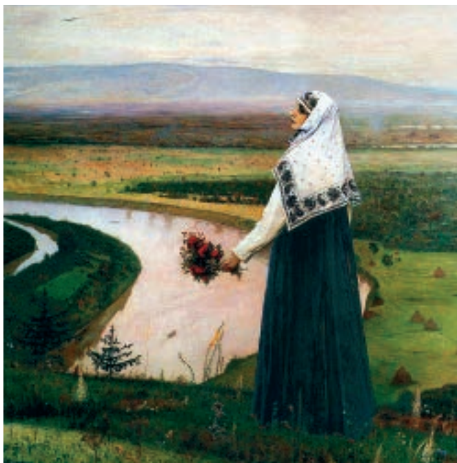
М.В. Нестеров «На горах»

Меняются законы, меняются правители, государственный строй. Бушует житейское море. Неизменно несет ко спасению свою паству церковный корабль, ковчег. Спасение от чего? Ради чего? Так трудно стало разобратся в современном мире, откуда может угрожать духовная опасность. Может быть, от самих себя... Меняются эпохи — меняемся мы. Неизменной остается лишь жажда по утраченному Адамом... И тем сильнее она, чем сильнее влияния внешние. Известно ведь еще со школьной скамьи — духовной жаждою томятся, как правило, «в пустыне мрачной». Таково последствие грехопадения человеческого, преодоление которого должно иметь себе «единым предметом нашей нужды». В этом справедливо видят оправдание своего