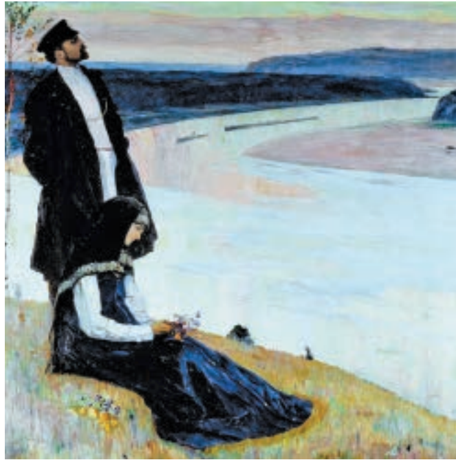
М.В. Нестеров «На Волге»

Желанием найти путь к истинной вере объясняются и размышления героев о церковной жизни: своей, древлеправославной и — пореформенной. Один из персонажей говорит: «в Великороссийской... есть и церковные отступления от древних святоотеческих обрядов и преданий, есть церковные неустройства, много попов и других людей в клире недостойных, прибытками и гордостью обуйных, а в богослужении нерадивых и небрежных. Все это так, но вера у них чиста и непорочна. На том самом камне она стоит, о коем Христос сказал: "На нем созижду Церковь мою, и врата адовы не одолеют Ю"». В то же время произносящий таковые слова остается верен старому обряду, хотя осознает, что именно «Великороссийской Церкви» принадлежит полнота религиозной истины. Здесь, по мнению автора, сходятся две реки, способные дать полноценное русло русскому церковному судну. Он не боясь высказывается в том смысле, что «образование старообрядцев внесет в нашу жизнь новые элементы или, лучше сказать, старые, забытые нами от наплыва западных понятий и обычаев, не сродных ни русской земле, ни русской душе». Еще ранее он писал, что «поповщинский раскол есть оппозиция старины против нововведений правительства», не более того. Очевидно, таким образом, что преодолению раскола может и должно служить промыслительно учрежденное Павлом I единоверие. Данный вопрос волновал Мельникова, и он настойчиво докладывал в свое время правительству, что «отказ предоставить единоверцам самостоятельное архиерейство привел к заметному сокращению