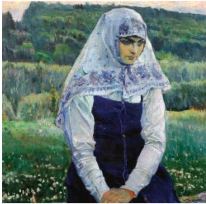
М.В. Нестеров «Невеста Христова»

Видно, что на этот раз писатель вкладывает в образы героев свою душу, выписывает их с любовью, неторопливо, бережно. Не анекдоты сочиняет, а как бы синоксарь читает, выразительно, нараспев. И персонажи выходят из под его пера значительные, яркие, похожие немного на героев народных песен, сказаний, что совсем не портит их. Напротив, образы органично вписываются в общую былинность повествования. В свою очередь, и автор не отстраняется от своих героев, говорит с ними на одном языке, что и подкупает читателя, создает впечатление правдоподобности. Странное дело: явная фольклорность образов не оставляет ощущения натянутости, фальши, как это было в ранних рассказах. Впрочем, читать романы Мельникова-Печерского — душевное удовольствие. Однако правды ради необходимо напомнить: те, кто захочет постичь мир старообрядчества по «лесам» и «горам», совершат безусловную ошибку, такую же, как изучающие войну 1812 года по роману Толстого или пугачевское восстание по «Капитанской дочке». При том что все упомянутые авторы добросовестно трудились в архивах и проч. Художественное произведение имеет свою, отличную от публицистики ценность.