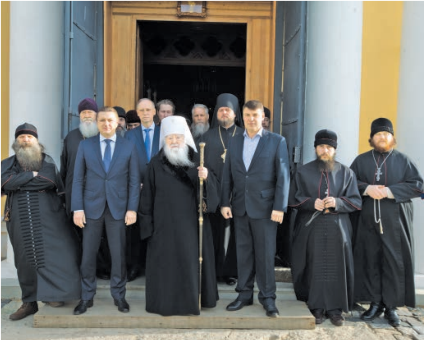
После богослужения. 21 ноября 2018 года

наших верующих. Сегодня у нас особенный день, ведь мы веруем, что по рождению мы получаем Ангела Хранителя, который ведет нас ко спасению. И вот сегодня, когда мы отмечаем праздник Архистратига Божия Михаила, Архангелов и Ангелов, то, значит, мы празднуем и день наших небесных покровителей, значит и у нас сегодня день Ангела. Это согревает и ободряет наши сердца, поэтому я горячо и сердечно поздравляю с праздником всех вас. Не так часто, но раз в году я бываю здесь, потому что хочется не только вдохновить и поощрить подвижников этого места, но и самому почерпнуть силу от вашей молитвы. Я думаю, что сейчас мало храмов, где утреннее богослужение, в котором мы сегодня участвовали, длится по четыре-пять часов. Я горячо и сердечно поздравляю духовенство, тружеников этого храма и вас