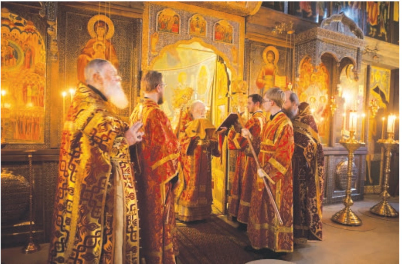
Митрополит Ювеналий принимает святую Чашу на Великом входе. 21 ноября 2018 года

и спасени будем». При четвертом пении Трисвятого на греческом языке митрополит Ювеналий то же действие совершил трикирием, возгласив «Троице Трисвятая, Отче и Сыне и Святыи Душе. Призри с Небесе от святаго жилища Твоего и благослови всех нас». В толковании архиерейского чина богослужения указывается, что три свечи трикирия являют собой образ Триипостасного Божества, и во время пения Трисвятого все ангельское множество поклоняется Троице со страхом, дивясь милосердию Божию: как тленному человеку возможно исполнять Херувимское и Серафимское пение Святой Троице?!