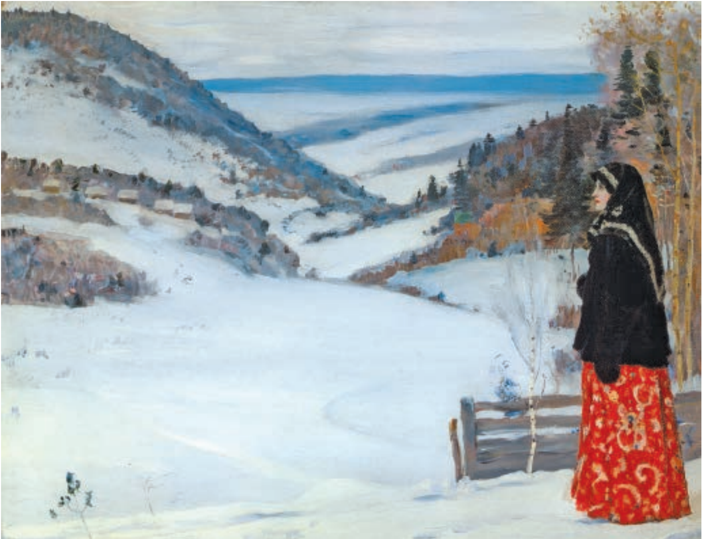
М.В. Нестеров «Зима в скиту»

ровал ей покой и благоденствие. Но ни Островский, ни герой нашего повествования не могли бы и предположить, к чему приведет европейское просвещение, сегодняшняя вседозволенность нравов при полном распаде самого понятия семья.