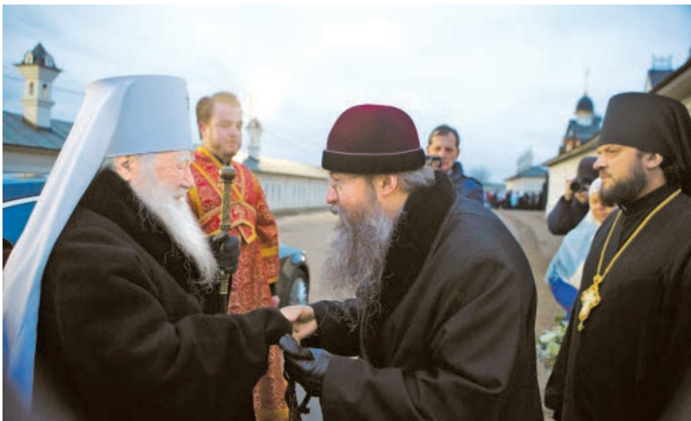
Встреча Владыки Ювеналия. 21 ноября 2018 года

Д ля членов Михаило-Архангельской единоверческой общины Престольный праздник всегда имеет очень важное значе- ние. К нему усердно готовятся, его с нетер- пением ждут. В 2018 году торжество этого святого дня с единоверцами разделил их