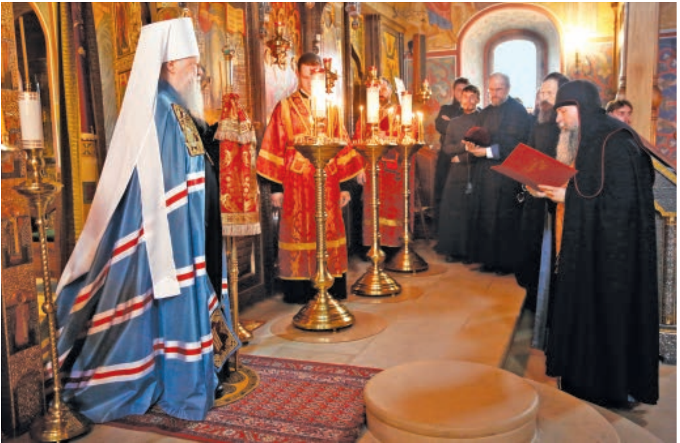
Приветственное слово отца настоятеля. 21 ноября 2018 года

Духовная радость сегодняшнего торжества многократно умножилась благодаря Вашему, дорогой Владыка, посещению сего древнего святилища и дарования нам возможности разделить с Вами пир веры, который являет собой архиерейская Божественная литургия.