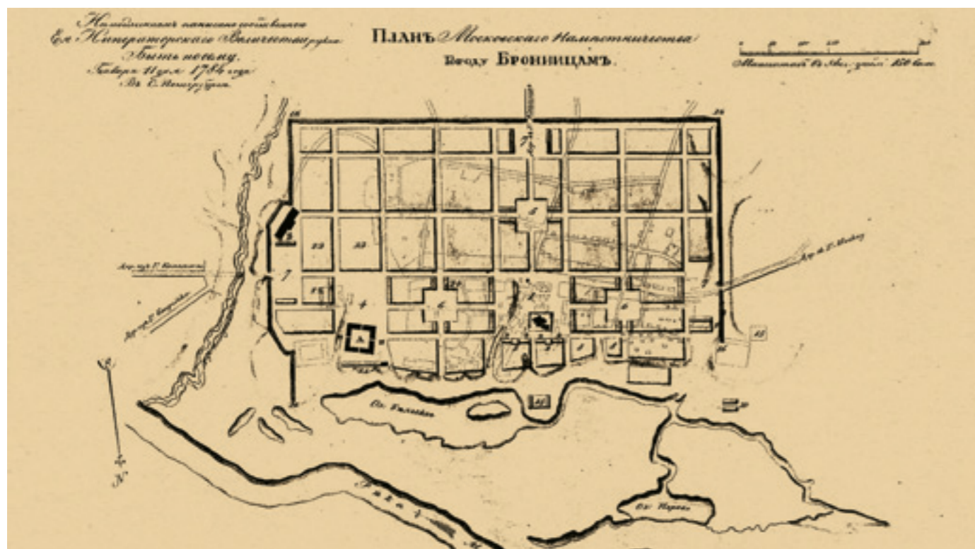
План Бронниц. 1784 год

дней, 22 декабря 1770 года, Солтыков сообщил о начавшейся эпидемии императрице Екатерине II 1 .