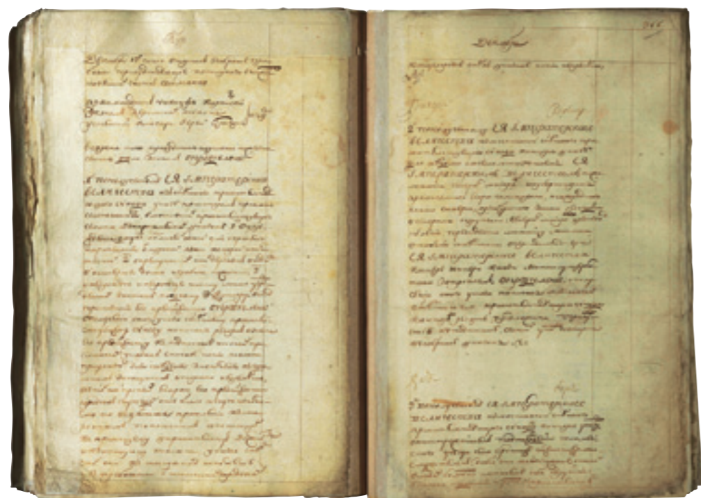
Журнал Коломенской духовной консистории. 1771 год.

Упоминание о крестных ходах в Бронницах во время эпидемии чумы.