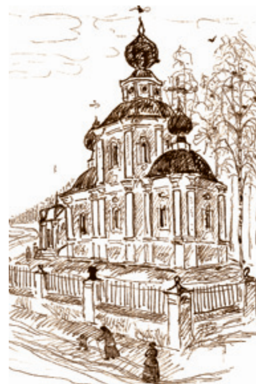
Рисунок Б. Шергина из собрания семьи Шульман

А вот сподобил бы меня Бог чина иноческого, и я бы как в рыцари себя счел посвященным.