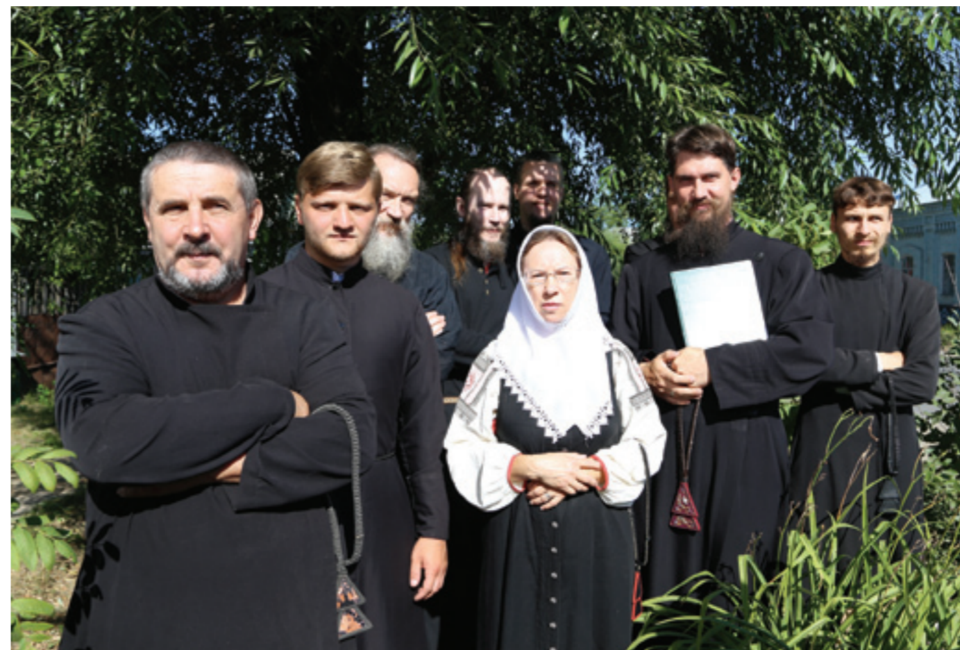
Клирошане на встрече архиерея Фото 2017 года

В зрелом возрасте стал уставщиком. Увы, несмотря на все потуги старообрядцев, священник, окормлявший общину в Кузнецке, открыть храм не позволил. Отец Варсонофий осознавал, что сохранить «старую веру» было возможным лишь в единоверии. На тот момент правящим архиереем Пензенской епархии был архиепископ Филарет (Карагодин). Он и дал благословение на создание в Кузнецке единоверческой общины. Будущий единоверческий священник все еще ходил в белокриницкую моленную, но понимал, что древнее благочестие нужно сохранять через единоверие. Благодаря письму на имя митрополита (сегодня — Патриарха) Кирилла, на тот момент возглавлявшего Комиссию по взаимодействию со старообрядчеством, община получила регистрацию 6 апреля 2007 года как Никольская единоверческая.