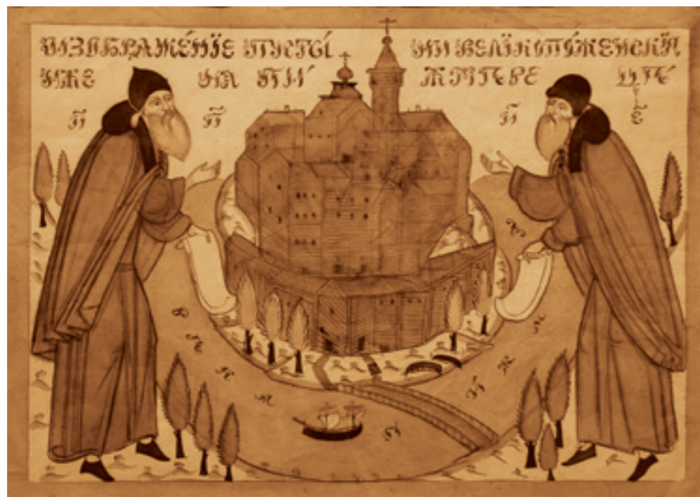
Изображение пустыни Великопоженския, иже на Пижме реце

воскресенью", к "Двенадцати Евангелиям" и к заутрени Светлой. Эти домишки так ласковы, после зимы-то, таращатся подслепыми окнами на солнышко. Обсохшие тротуары, омытые недавними ручьями, таявшими снегами мостовые еще так чисты. Еще нет пыли, еще уютится по дворам, по углам остаток снега. Еще так ясно, непорочно чисто небо над городом.