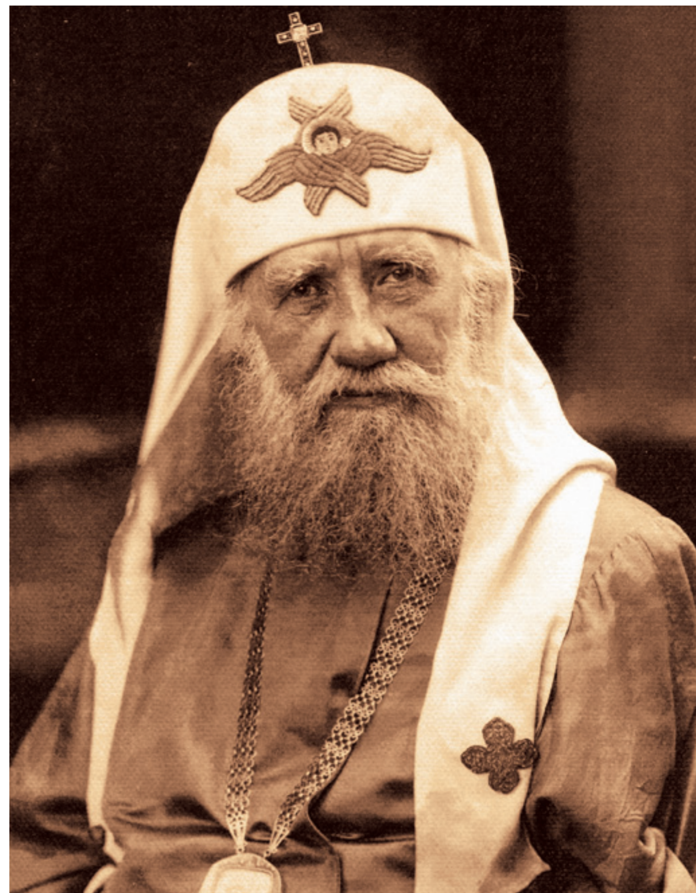
Святейший Патриарх Тихон. 1924 год