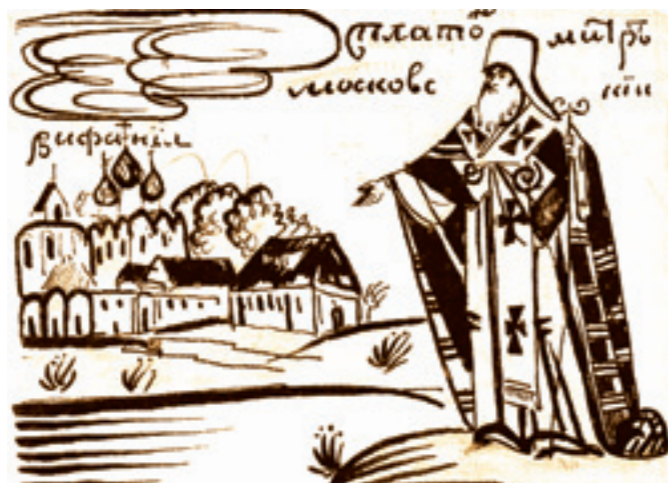
Рисунок Б. Шергина. Платон, митрополит Московский

Живя в Средней России, люблю, полюбил и по брату 8 ставшего близким сердцу моему Савву Звенигородского. И кто еще? Да всех