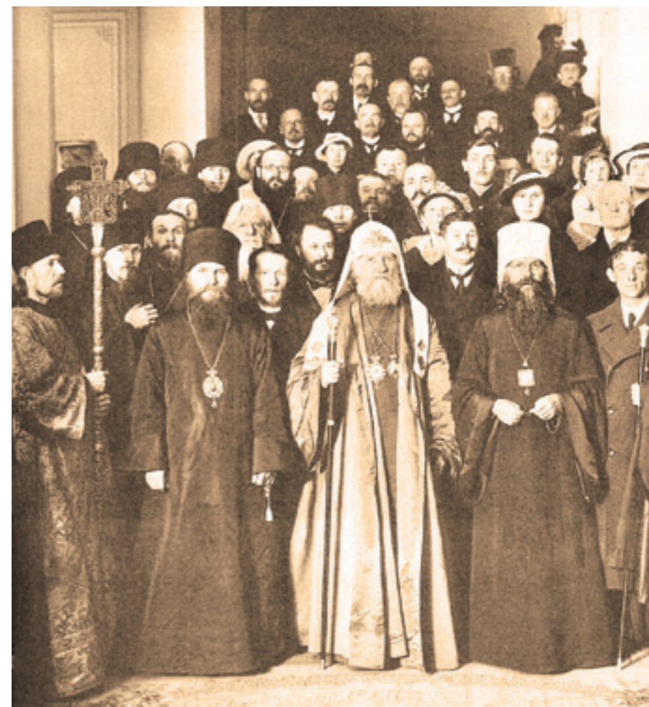
Патриарх Тихон в Петрограде. 1918 год

В 6 часов вечера в субботу, 15 июня, по возвращении из Кронштадта Патриарх Тихон совместно со всеми епископами, находившимися в Петрограде, совершил наречение архимандрита Симона (Шлеева) во епископа единоверческого Охтенского. В храме Троицкого подворья был поставлен покрытый сукном стол с возложенными на него Евангелием и крестом. С обеих сторон от стола стояли стулья, на которых во время обряда наречения сидели митрополит Вениамин и викарии Петроградской епархии еписко-