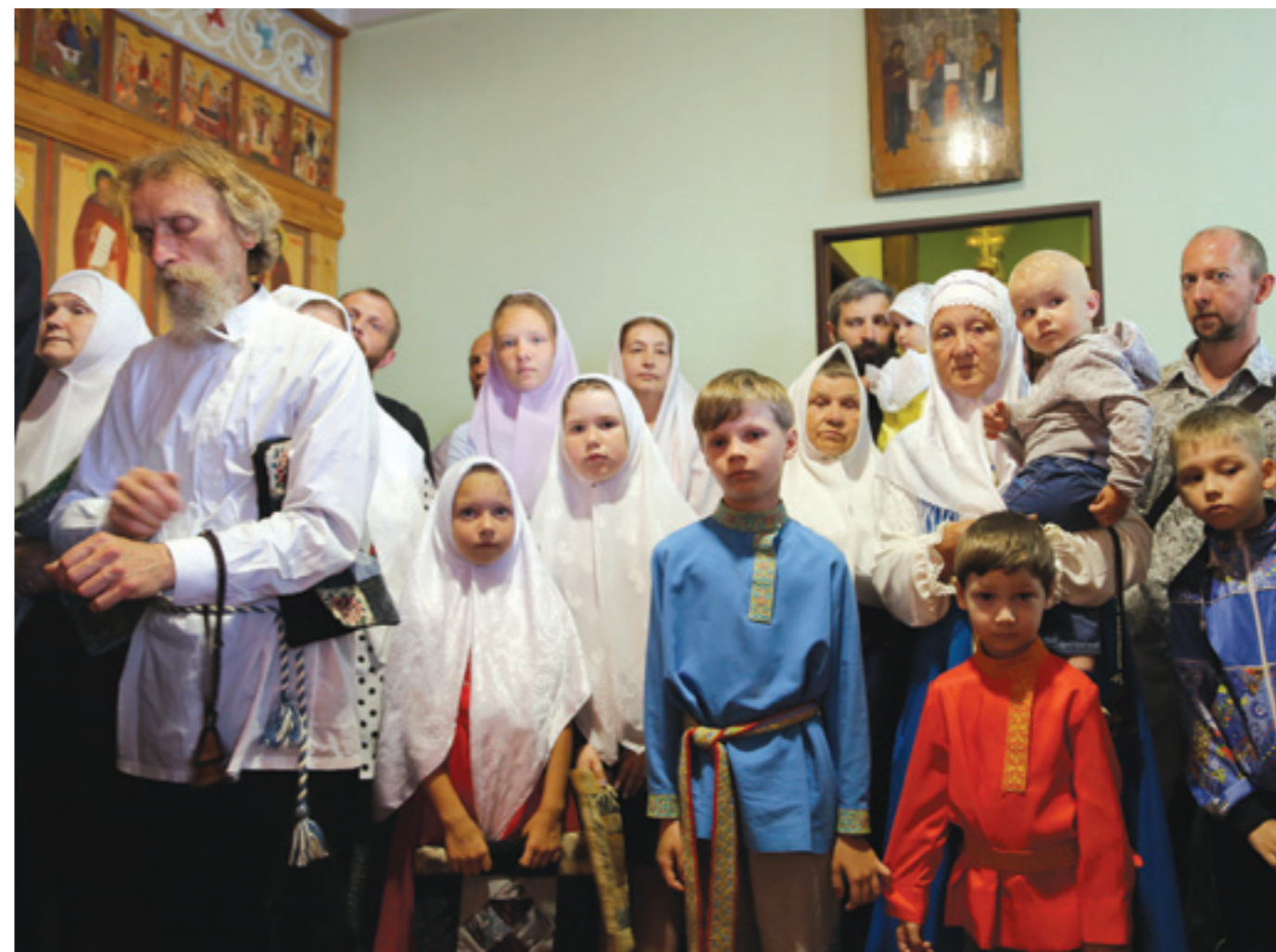
Кузнецкие богомольцы. Фото 2017 года

Сейчас в общине более 50 человек. В маленьком, но уютном храме ежегодно совершаются архиерейские богослужения. Эту традицию установил нынешний правящий архиерей Кузнецкой епархии владыка Нестор. Он же назначил и постоянный день для этого торжества – 11 августа – Рождество святителя Николы Чудотворца (память об этом событии имеет сугубое значение и для