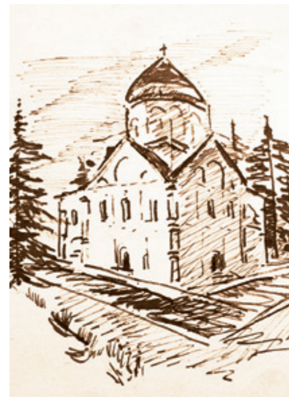
Рисунок Б. Шергина из собрания наследников И.И. Халтурина

Церковь — земля хлебородимая, плодородная. Если томится твоя душа в сем житии, желанием чудным полна, знай, — только Церковь утолит чудную оную тоску. Нету зимы в Церкви, но всегда лето благословенно-плодное. Вот январь месяц круга церковного, бытия годичного. Точно нивами идешь золотыми, спеющими. Се поля Васильевы вседозволенные, се Григорьевы хлеба вечнующие, се Иоанновы красуются нивы сладкие словес золотых. Январь месяц, а в Церкви живя, что лугами ароматносными ходишь. Тамо цветы