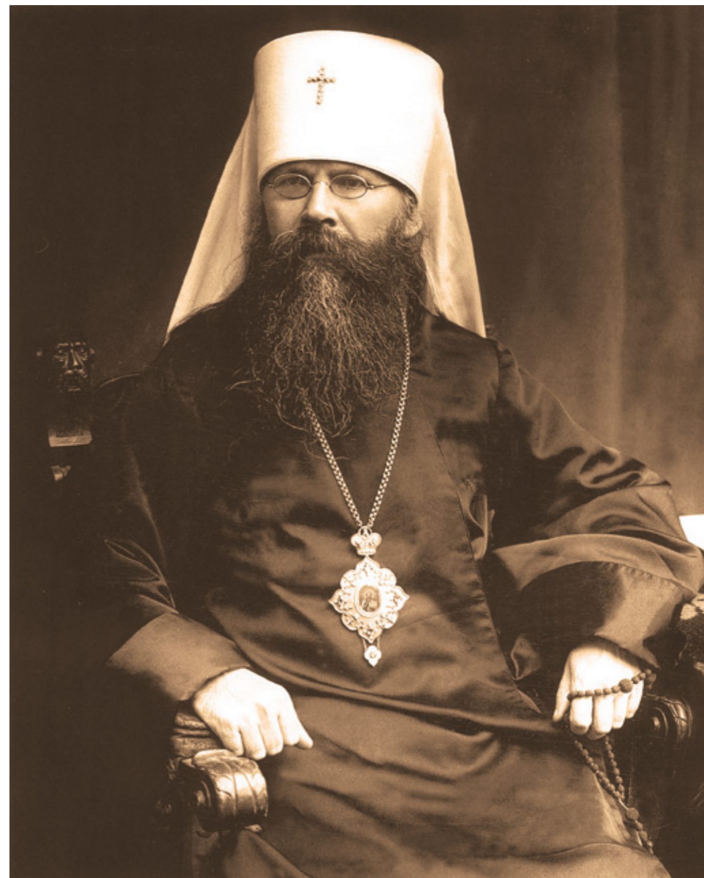
Митрополит Петроградский и Гдовский Вениамин Фотография 1918 года, фотоателье Буллы

рублей и о безвозмездной передаче Охтенской кафедре принадлежащего общине доходного дома в Петрограде на углу Стремянной улицы и Дмитровского переулка. Постановление общины было сочувственно встречено духовенством и мирянами единоверческих приходов, тем более что вопрос об учреждении епископской кафедры уже много раз получал в их среде разрешение в смысле его крайней необходимости и неотложности (в частности, на единоверческом епархиальном съезде Петроградской епархии 10 июля 1917 года). 19 марта 1918 года