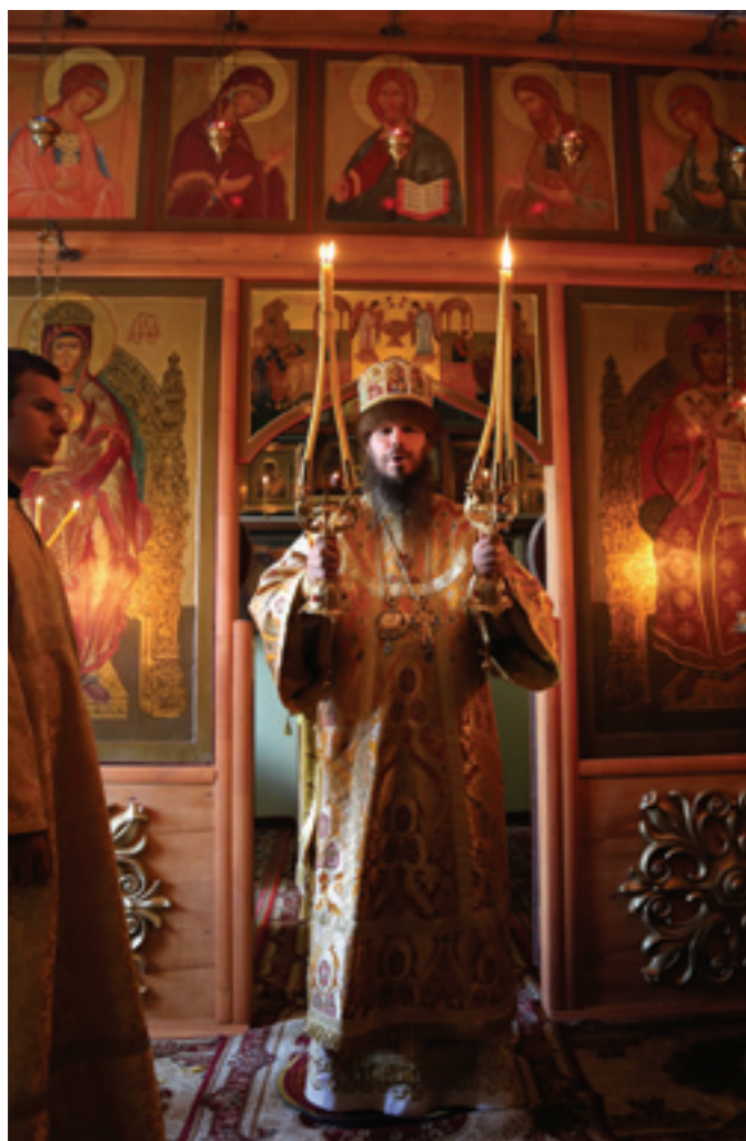
Епископ Нестор. Фото 2016 года

в то время каменном храме. Лишились икон, книг, утвари. Всего, что жертвовалось и кропотливо собиралось.