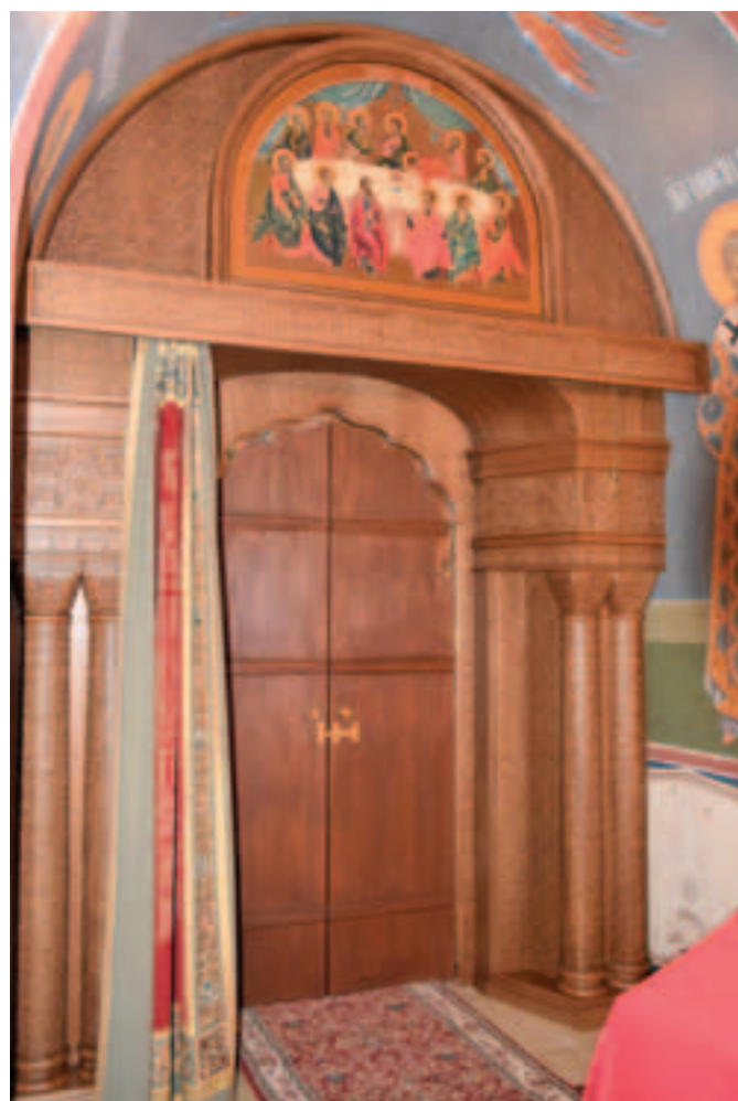
Дубовый резной портал, установленный с внутренней части Царских врат Михаило-Архангельского алтаря

Кроме насыщенной духовной жизни, продолжались работы по благоустройству