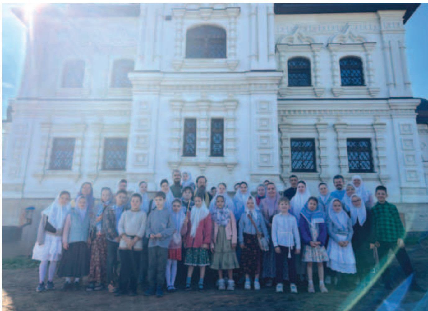
Участники молебна перед началом учебного года в Воскресной школе храма Архангела Михаила

У чебный год в Воскресной школе единоверческого храма Архангела Михаила по традиции начинается после праздника Индикта — Церковного Новолетия — 1/14 сентября. В нынешнем