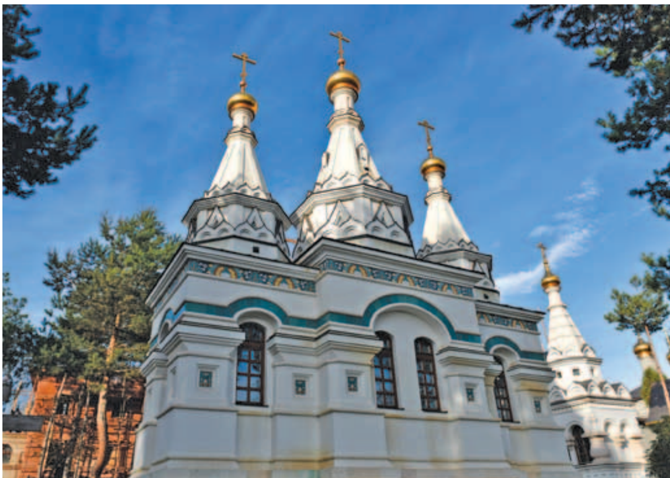
Часовня иконы Божией Матери Троеручицы на приходском кладбище

нашему Иисусу Христу, приводящему во двор Свой ины овцы, яже не суть от двора Его. Смиренный Августин, архиепископ Дмитровский. Лета 1817 месяца июля 4 дня».