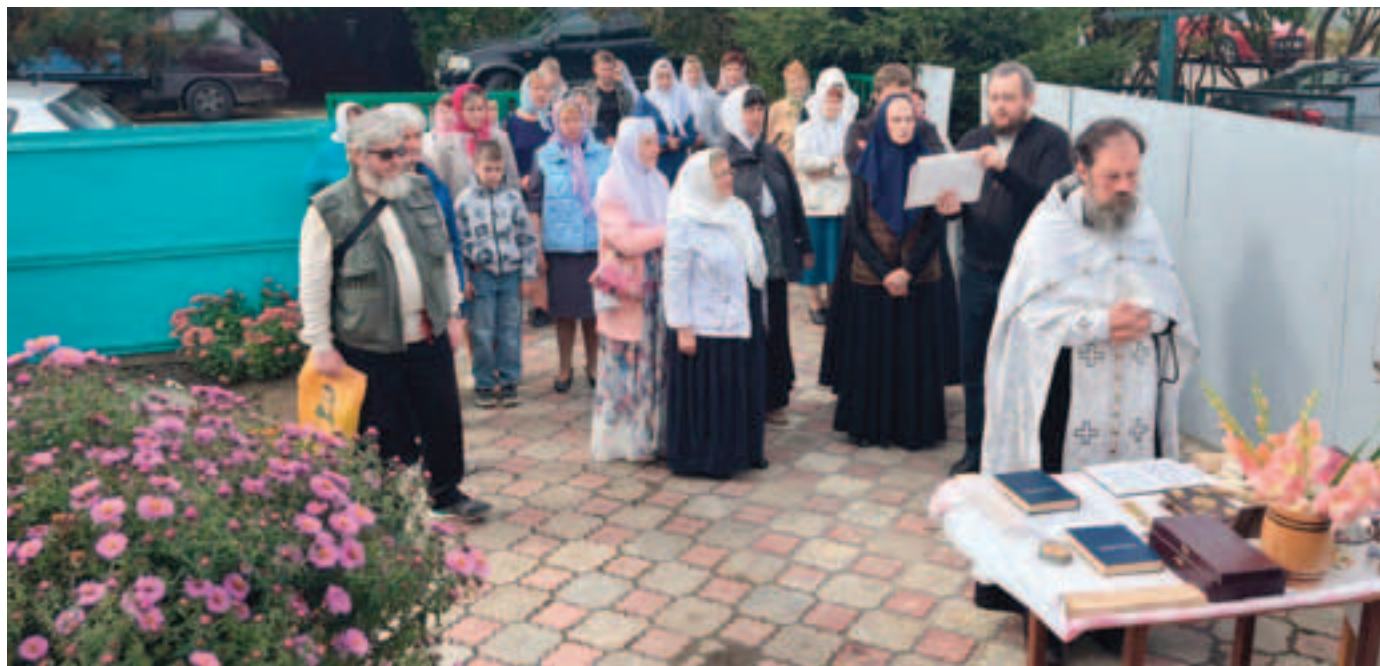
Молебен Рождеству Пресвятой Богородицы в деревне Заозерье