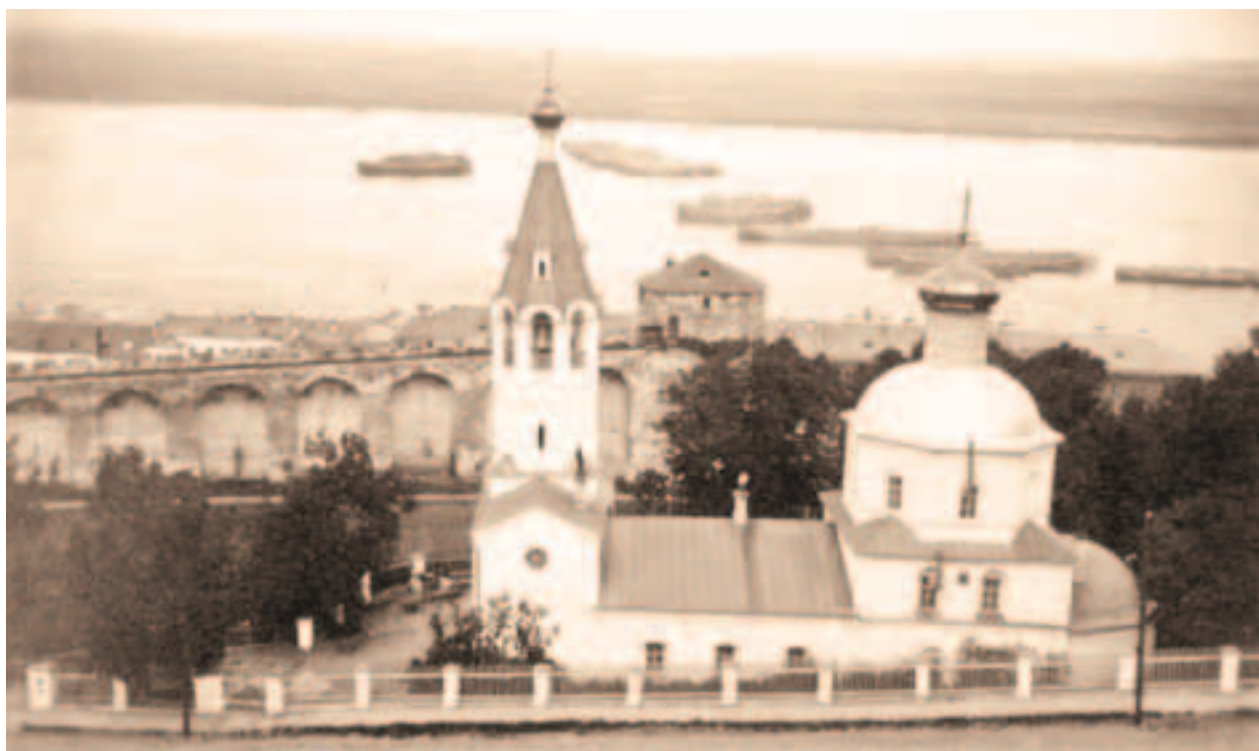
Единоверческая церковь преподобного Симеона Столпника в Нижнем Новгороде

и посещая живших поблизости старообрядцев.