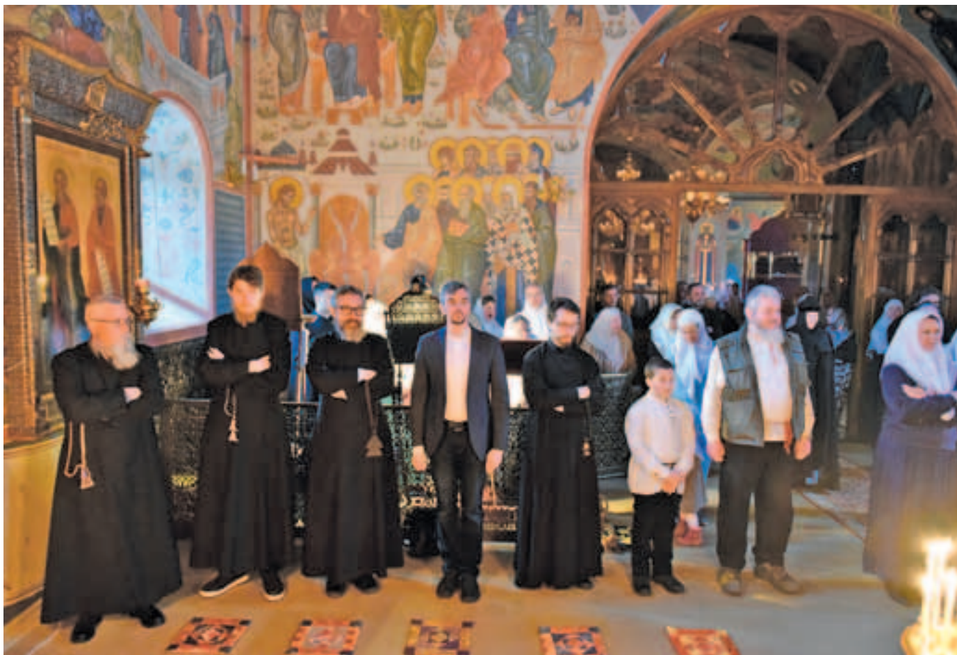
Прихожане во время праздничного богослужения

лись с чтением стихов избранного псалма, а в это время богомольцы попарно подходили к иконе Собора Архистратига Божия Михаила для поклонения, при этом им раздавались освященные в конце великой вечерни хлеба.