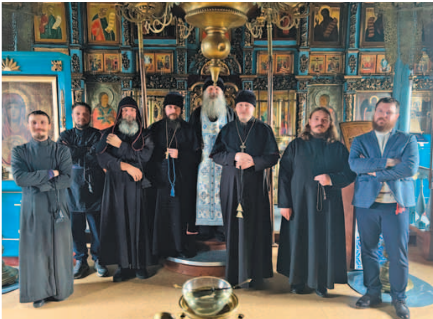
Участники Престольного праздника в храме Покрова Пресвятой Богородицы в селе Малое Мурашкино

храма, а затем многочисленные гости, причт храма и члены приходского собрания были приглашены к праздничной трапезе. Всем участникам богослужения были вручены подарки от управы Басманного района города Москвы — свежее испеченные хлеба.