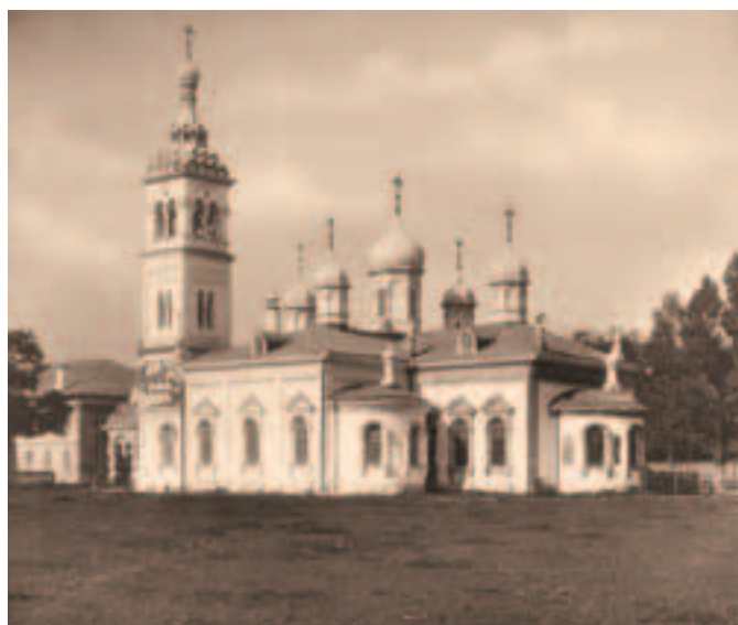
Никольский единоверческий храм при Рогожском кладбище. Фото 1883 года

К концу 1970-х — началу 1980-х годов оставалось лишь несколько действующих