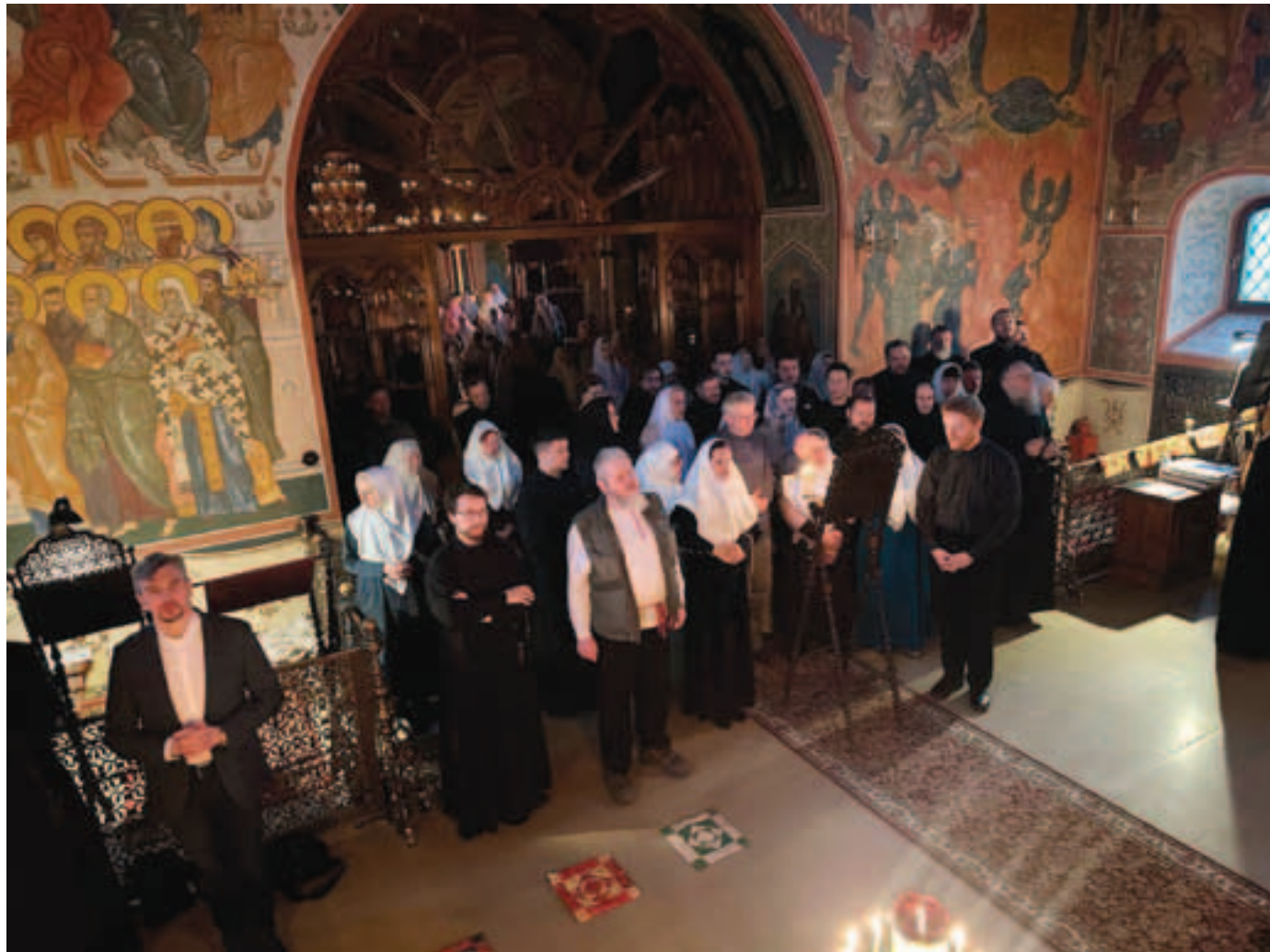
Объединенный хор на сходе во время малого входа

П раздник Собора Архистратига Божия Михаила и прочих Небесных Сил является венцом богослужбного года для Михаило-Архангельской единоверческой общины. Этот день очень любим и высоко почитаем священнослужителями и прихожанами храма, а также представителями других единоверческих общин, посещающими в этот день Михайловскую Слободу. Не стал исключением и Престольный праздник 2025 года.