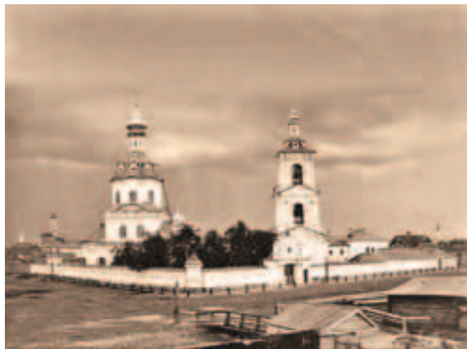
Единоверческая церковь Четырех Евангелистов в Казани

Столетие единоверия праздновали оба единоверческих прихода города Казани — Никольский и храма Четырех Евангелистов.