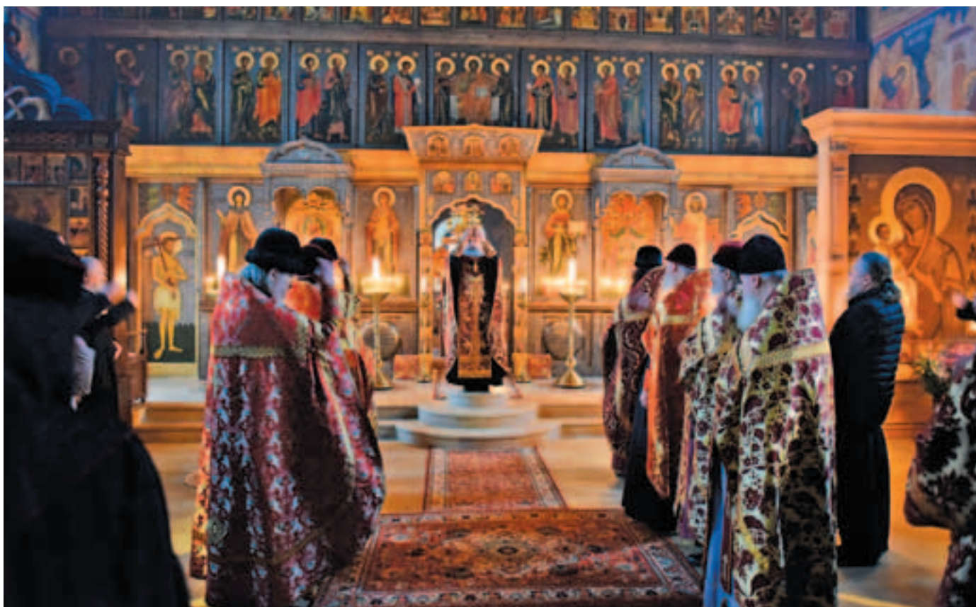
Священноархимандрит Иринарх осеняет крестом молящихся при пении многолетий