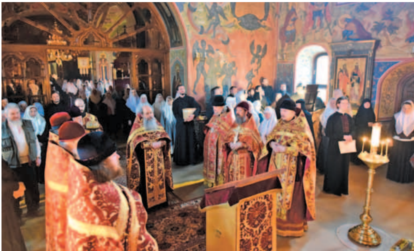
Духовенство перед иконой Собора Архистратига Божия Михаила