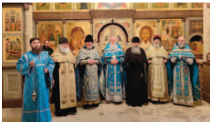
Священнослужители — участники престольного праздника в храме Покрова Пресвятой Богородицы в Рубцове города Москвы

14 октября 2025 года в день празднования Покрова Пресвятой Богородицы в Покровском храме в Рубцове была совершена праздничная литургия древнерусским чином.