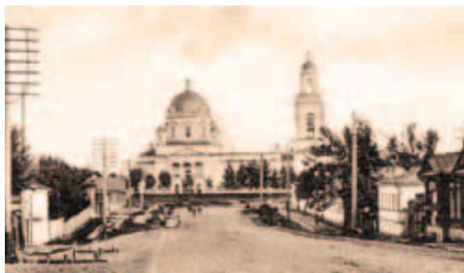
Свято-Троицкая единоверческая церковь Екатеринбурга