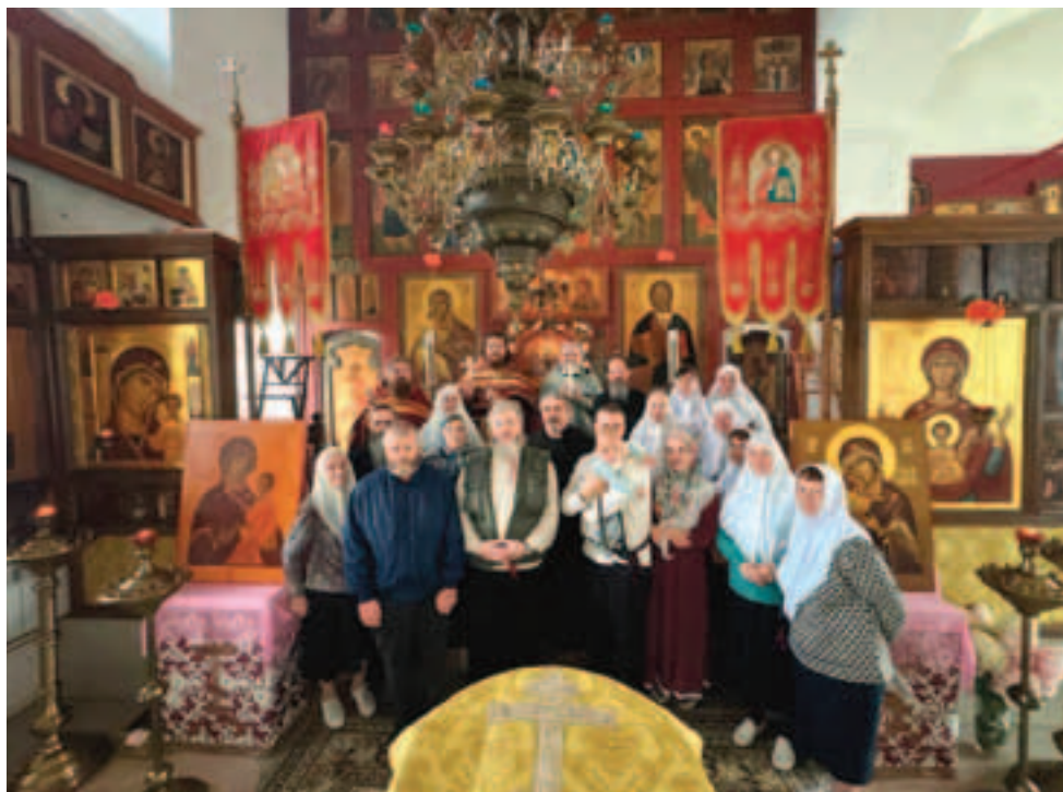
Священнослужители, прихожане и гости храма после окончания праздничного богослужения

26 августа / 8 сентября 2025 года в единоверческой церкви Владимирской иконы Божией Матери села Осташово состоялось торжественное богослужение, посвященное Престольному празднику храма.