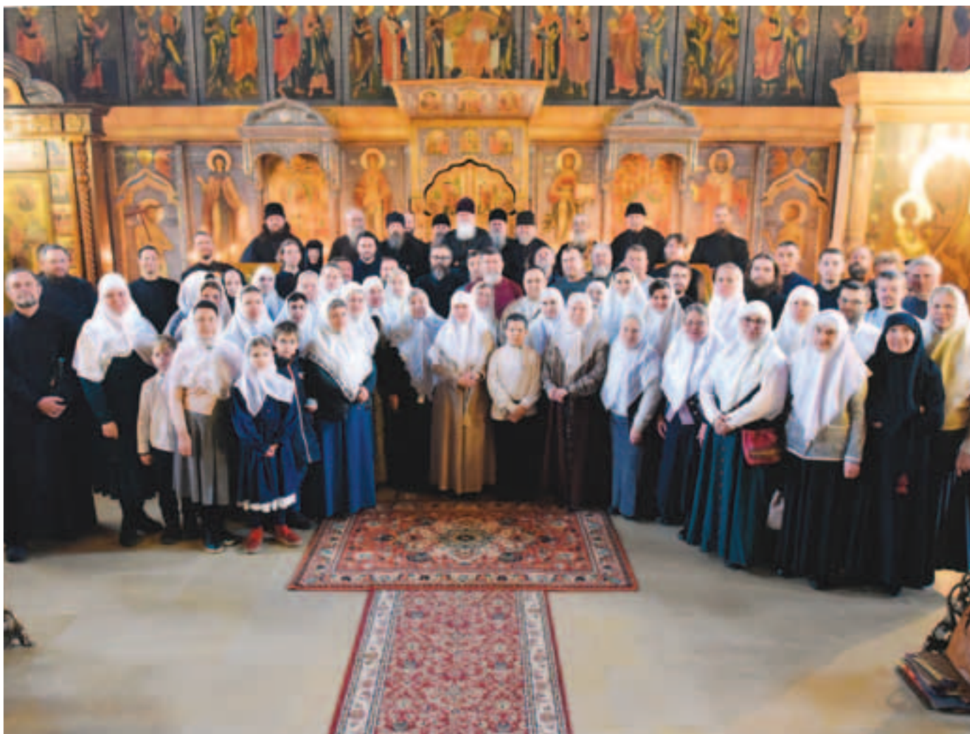
Участники Престольного праздника храма Архангела Михаила

А.А. Ухтомский. О церковном пении 33 . ИСТОРИЯ ЕДИНОВЕРИЯ «Торжество православного старообрядчества»: О ПРАЗДНОВАНИИ 100-ЛЕТНЕГО ЮБИЛЕЯ ЕДИНОВЕРИЯ В РОССИИ В НАЧАЛЕ XX ВЕКА 39