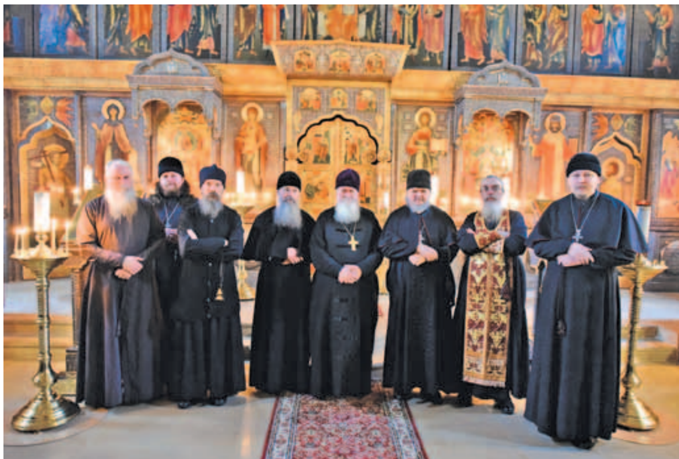
Священнослужители – участники праздничного богослужения

пятого гласа «Радуйся Живоносный Кресте» и четвертого «Иже свыше званый». Мощное и слаженное пение клиросов усиливало ощущение торжественности Престольного праздника. В положенные уставом моменты богослужения: на малом и великом входах, при пении Херувимской песни и задостойника «О Тебе радуется» клироса объединялись на сходе, вместе составляя общий хор почти из тридцати человек.