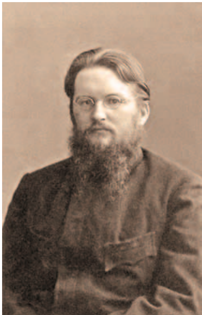
Князь А.А. Ухтомский. Начало 1900-х годов

Для Ухтомского Н.Е. Введенский стал еще одним учителем — и в научном, и в человеческом плане. Впоследствии он вспоминал: «Знакомясь в университете с биологическими науками и интересуясь вопросами психологии и физиологии актов поведения, я понял необходимость в изучении физиологии. Введенский был учеником Сеченова, он был крупным ученым, который своими работами утверждал новый метрический метод в изучении жизнедеятельности тканей и органов. Его оригинальные идеи о переходах ткани от состояния возбуждения к торможению, о значении истории системы для осуществления той или иной реакции привлекли мое внимание. Кроме того, Николай Евгеньевич был человеком, целиком преданным науке, простым, добрым и внимательным к работающим у него. Великолепный экспериментатор, он не жалел времени и сил, чтобы помогать начи-