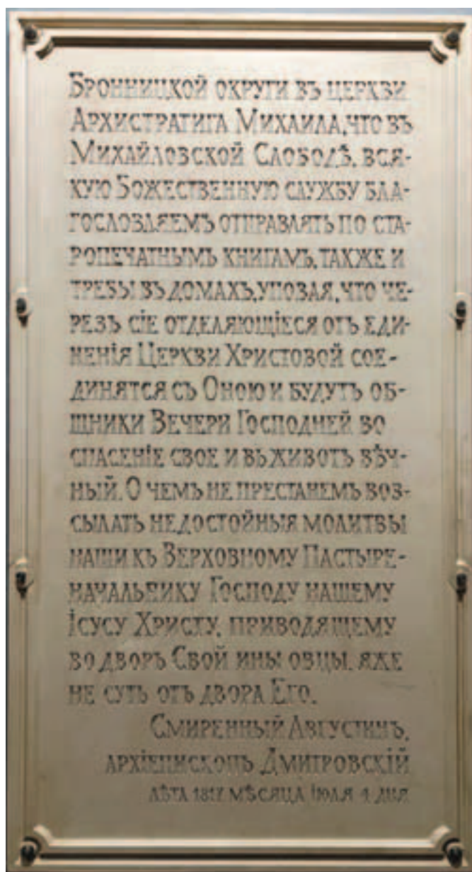
Памятная мраморная доска с текстом об учреждении единоверия в храме Архангела Михаила в 1817 году

кронштейнами, завершены работы по изготовлению, резьбе и установке дубового портала с внутренней части Царских врат Михаило-Архангельского алтаря.