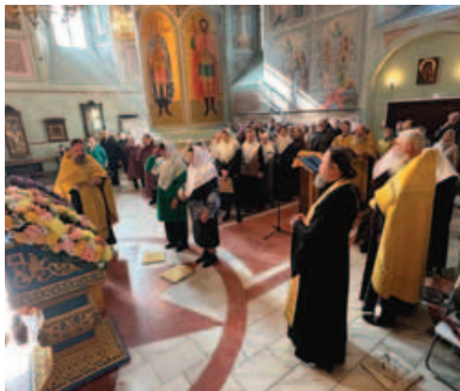
Поклонение мощам Святителя Тихона