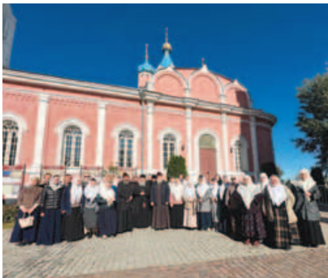
Духовенство и прихожане Михаило-Архангельского храма на Соборной площади города Коломны