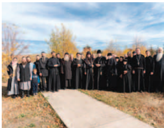
Участники архиерейской литургии в селе Кольцово

Были совершены полунощница, встреча и облачение архиерея, чтение третьего, шестого и девятого часов, а также Боже-