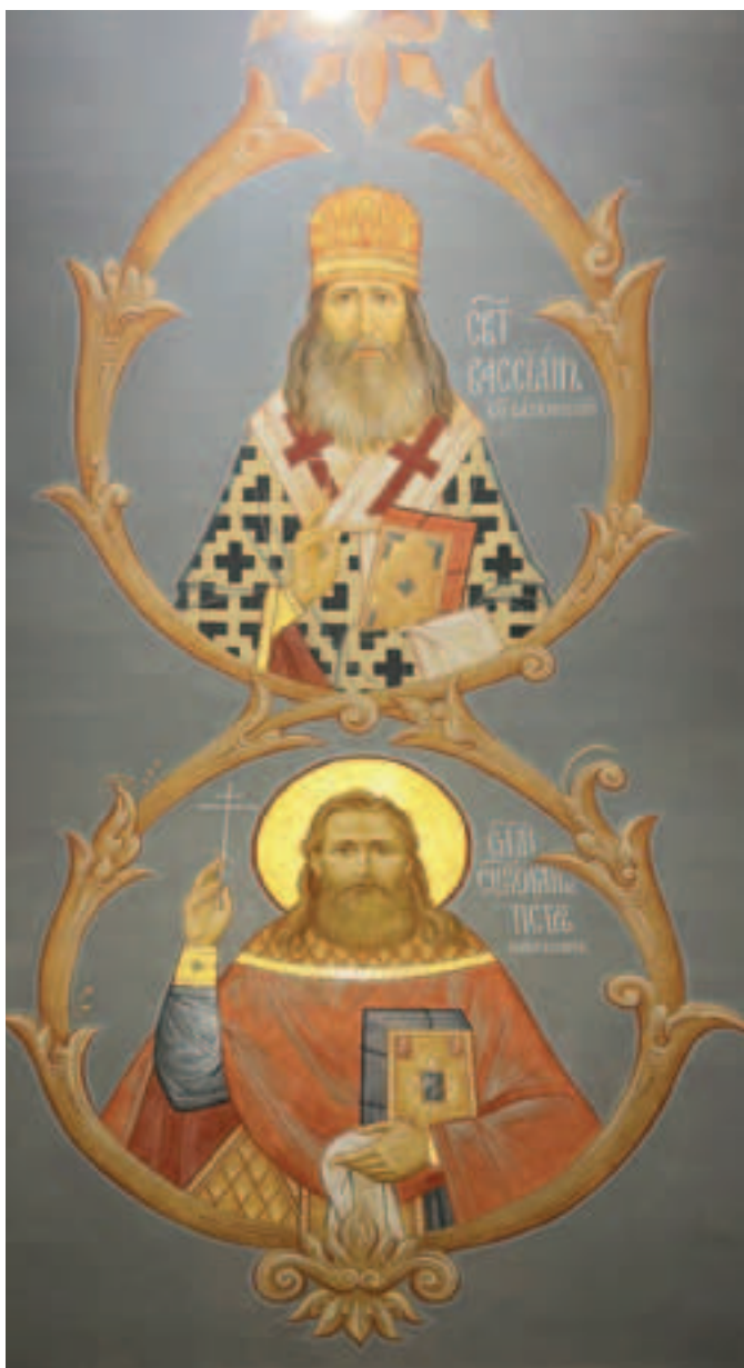
Настенные изображения единовещеского епископа Вассиана (Веретенникова) Саткинского и священномученика Петра Вяткина