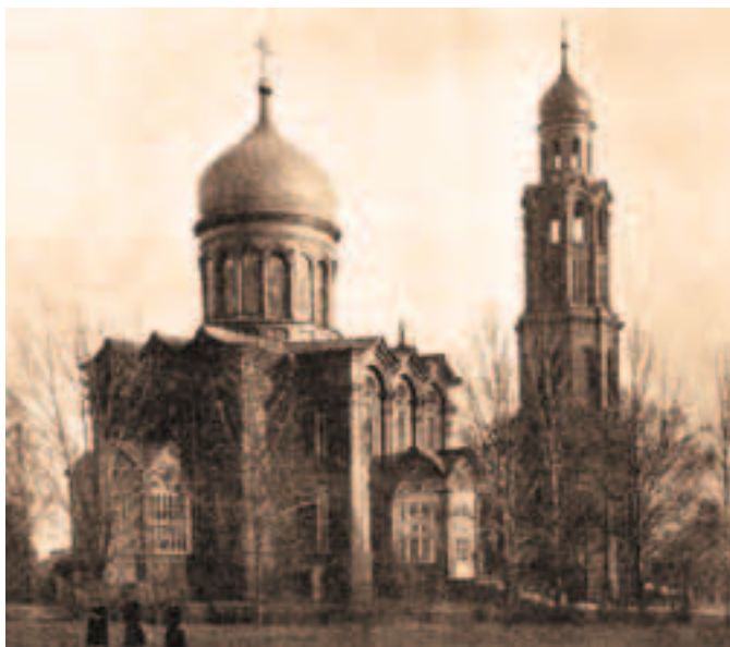
Главный храм монастыря в честь Всех Святых и колокольня

по резолюции Его Высокопреосвященства иждивением почетной гражданки Широковой и занят ею самою. Два деревянные дома, выстроенные один при церкви, а другой на кладбище, заняты церковными сторожами; 8. На содержание священно-церковнослужителей из суммы единоверческой типографии положено в Московскую сохранную казну на вечное обращение 5000 рублей серебром и разными лицами положено 6550 рублей серебром; 9. Содержание имеют порядочное; 10. На содержание церкви с разрешения Его Высокопреосвященства положено в Московскую сохранную казну 10 000 рублей серебром из суммы единоверческой типографии и от других лиц 3150 рублей серебром. 11. Лавок и домов, отдаваемых в наем при сей не имеется; 12. Расстоянием сия церковь от Московской Духовной Консistorии в 6 верстах, от местного благочинного в 2 верстах; 13. Ближайшие к сей церкви суть: Никольская, что в Рогожском Богадельном доме в 1 версте и Троицкая Единоверческая в 2 верстах; 14. Приписных церквей к сей церкви не имеется; 15. Домовых церквей нет. 16. Приходских дворов 19, душ мужеского пола 112, женска 79. 17. Причта при сей церкви ныне на лицо состоит: священник Алексей Алексеев Остроумов 40 лет, диакон Павел