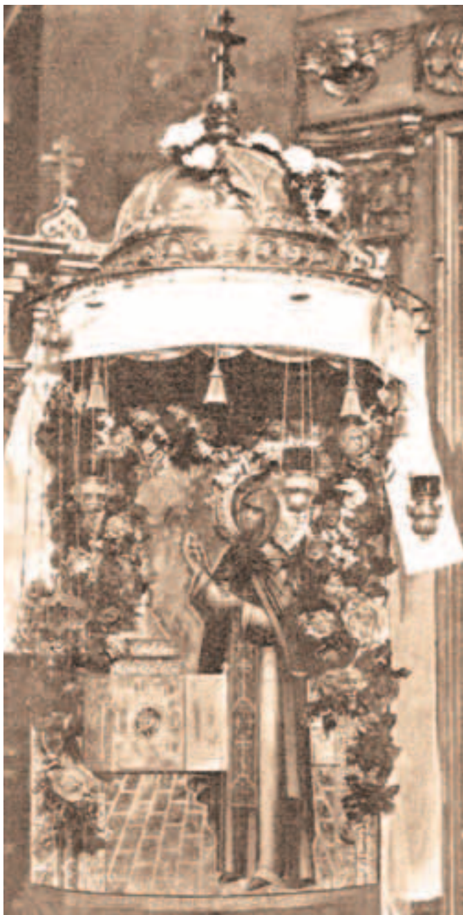
Икона преподобной великой княгини-инокини Анны Кашинской с частицей мощей, киотом и сенью, устроенная членами Никольского братства в Никольском единоверческом храме