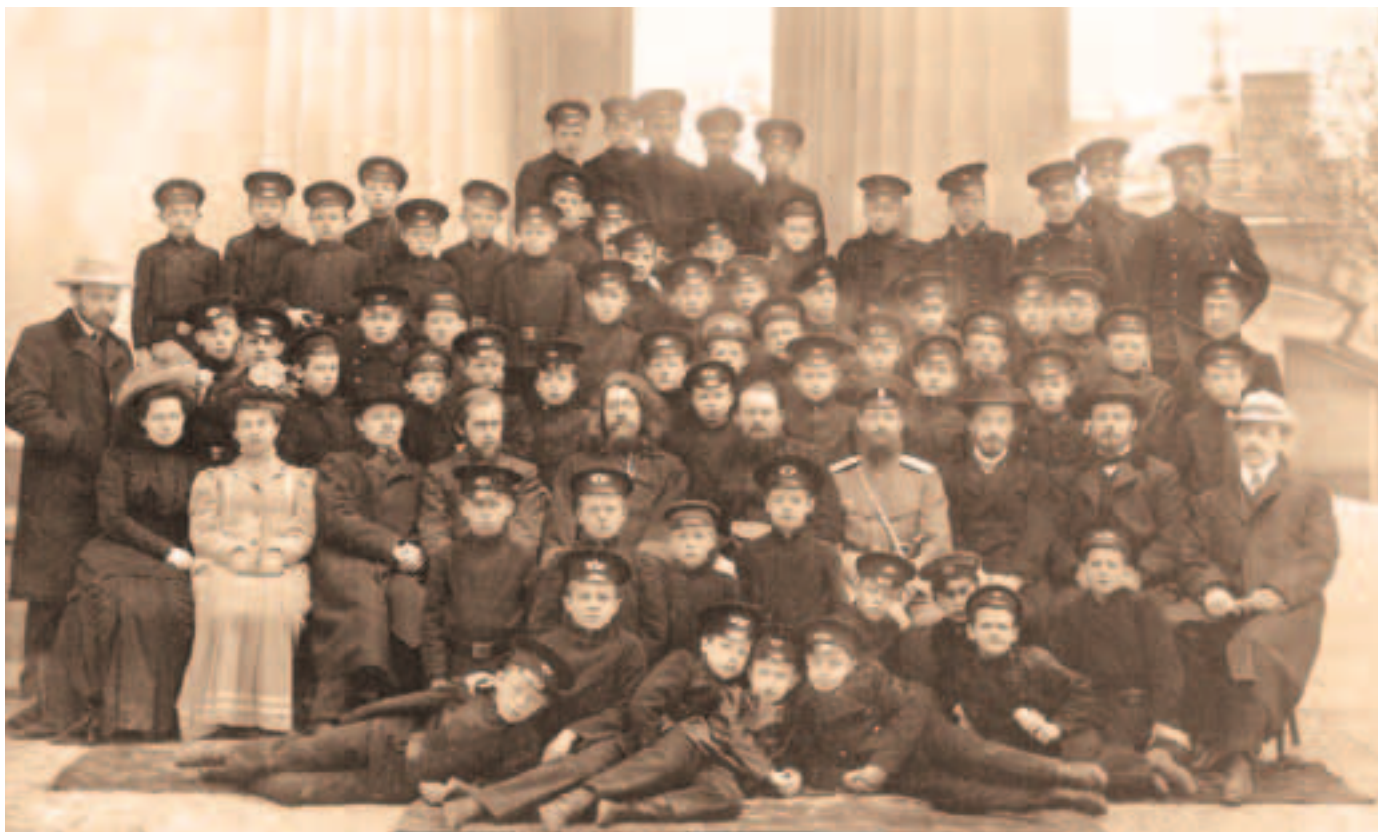
Учащиеся и преподаватели Братского реального училища