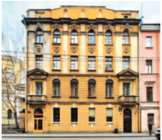
Здание Братского реального училища

В течение первого года в гимназии был один класс, состоявший из 11 учениц. На втором году существования гимназии количество ее учащихся составило 97 человек в шести классах, на третьем году число учениц возросло до 224, среди них было немало детей бежен-