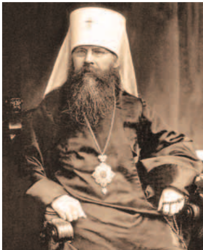
Епископ Гдовский (в будущем – митрополит) Вениамин (Казанский)

Патриарх Григорий IV сумел существенно улучшить ситуацию в Антиохийской церкви: он открыл целый ряд новых учебных заведений, поддерживал деятельность духовной семинарии, находившейся в Баламандском монастыре. Благодаря поддержке Патриарха Григория в 1909 году начал выходить журнал «Аль-Ниам», в котором публиковались официальные церковные документы, различные материалы о жизни Церкви, богословские и исторические статьи. По свидетельству современников, Патриарх Григорий был очень образованным человеком, он обладал благородным характером, поэтому к нему с большим уважением относились не только христиане, но и мусульмане.