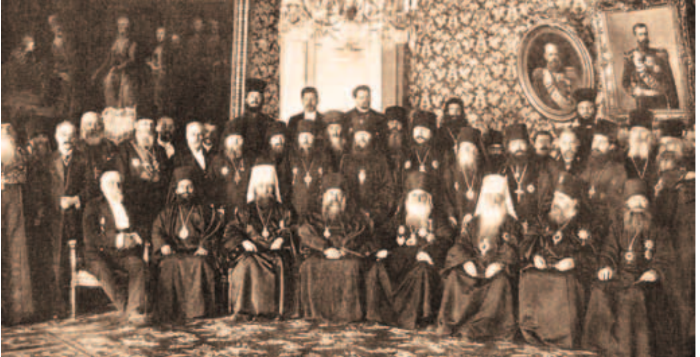
Патриарх Антиохийский Григорий IV (в первом ряду четвертый слева) во время визита в Санкт-Петербург