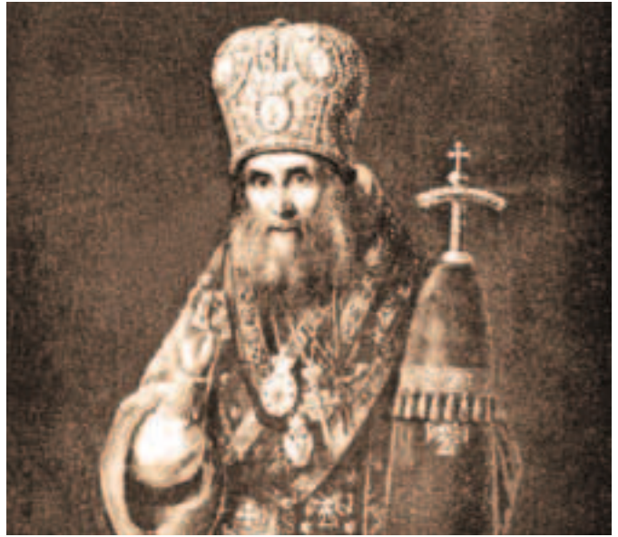
Святитель Филарет (Дроздов)

дарыни Императрицы Александры Феодоровны; таковое заупокойное поминовение должно продолжаться в монастыре вечно. 4. Для священно-церковнослужителей предполагается нами выстроить особенный дом с принадлежностями, поместительный для всего причта и служащих при монастыре сторожей и могильщиков. Место для того дома назначается близ самого Всехсвятского кладбища на церковной земле. Нужную для выстройки того дома сумму предполагаем отнести на тот же источник, который объяснен нами в третьем пункте сего нашего сведения. 5. Все принадлежности, как-то сараи, погреба и прочее есть на лицо. 6. При открытии монастыря предполагаем иметь один настоящий причт и желаем иметь штат священно-церковнослужителей тот же, какой ныне существует при Всехсвятской церкви. 7. С лицевой стороны по Нижегородскому тракту находится при вышесказанных корпусах каменная ограда, а с прочих трех сторон деревянная, только что выстроенная в прошедшем году» 5 . К сведениям прилагались также требуемые необходимые документы на землю и здания.