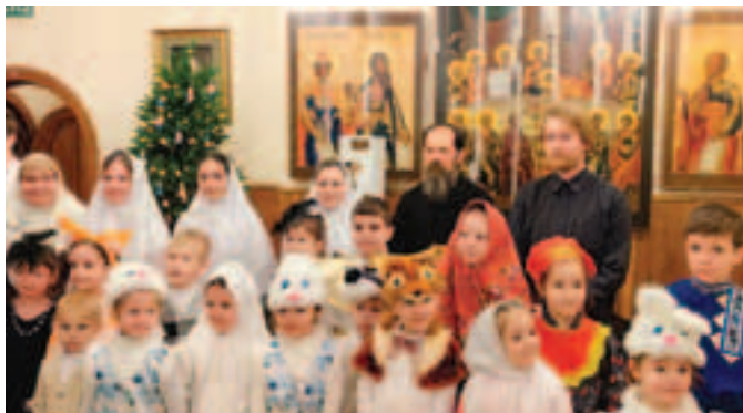
Учащиеся и преподаватели Воскресной школы

Т радиционный детский Рождественский праздник состоялся в приходе Михаило-Архангельского единоверческого храма села Михайловская Слобода 8 января 2024 года.