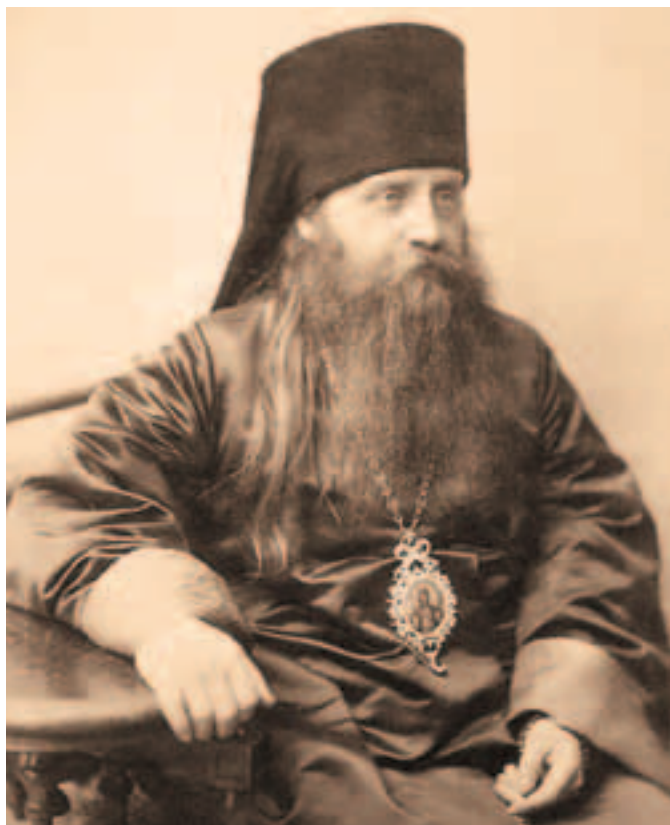
Архиепископ Волынский (в будущем – митрополит) Антоний (Храповицкий)