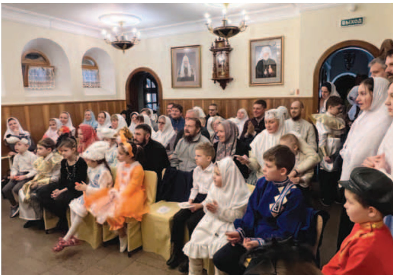
Участники и гости Рождественского праздника

ИСТОРИЯ ЕДИНОВЕРИЯ. История Московского Всехсвятского единоверческой женского монастыря 32. АРХИВНЫЕ НАХОДКИ Служение Антиохийского Патриарха IV в Единоверческой, что на Николаевской улице, города Санкт-Петербурга, церкви и значение его 37.