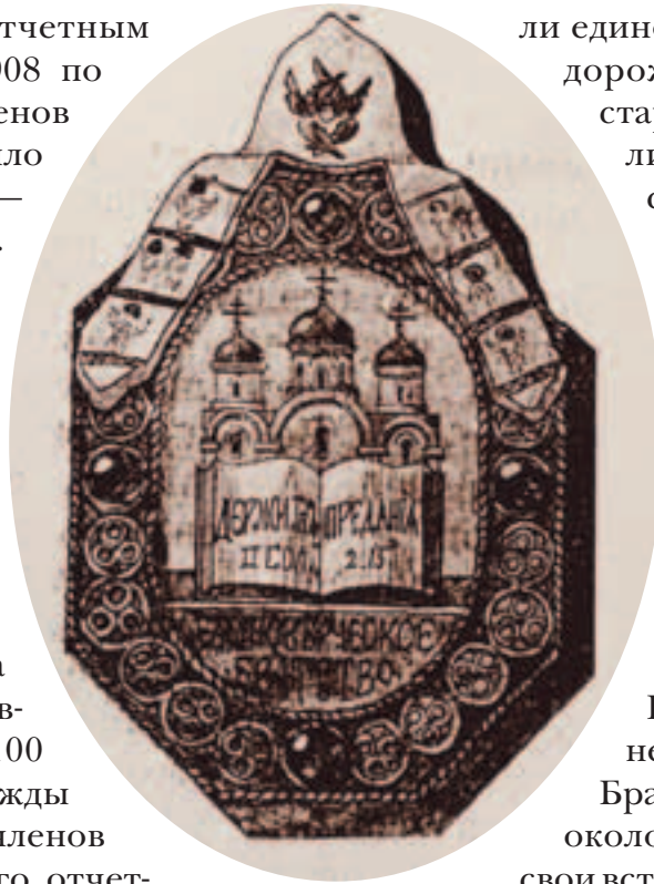
Знак Никольского единоверческого братства