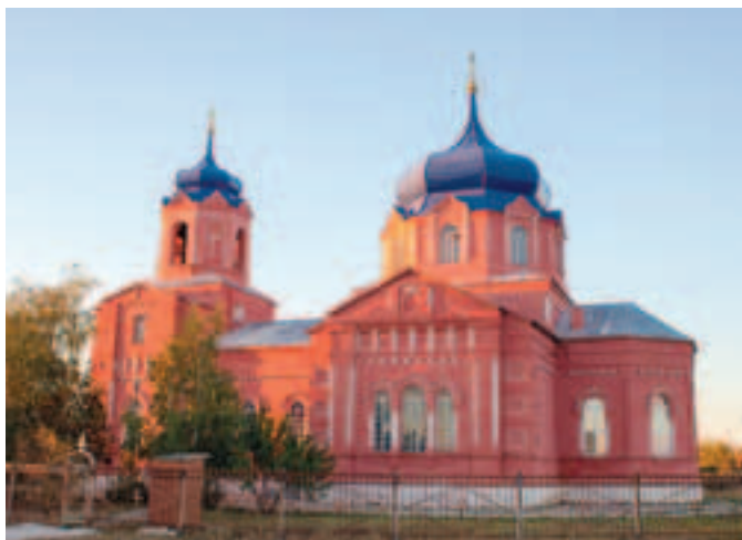
Михаило-Архангельский храм села Удельная Маянга