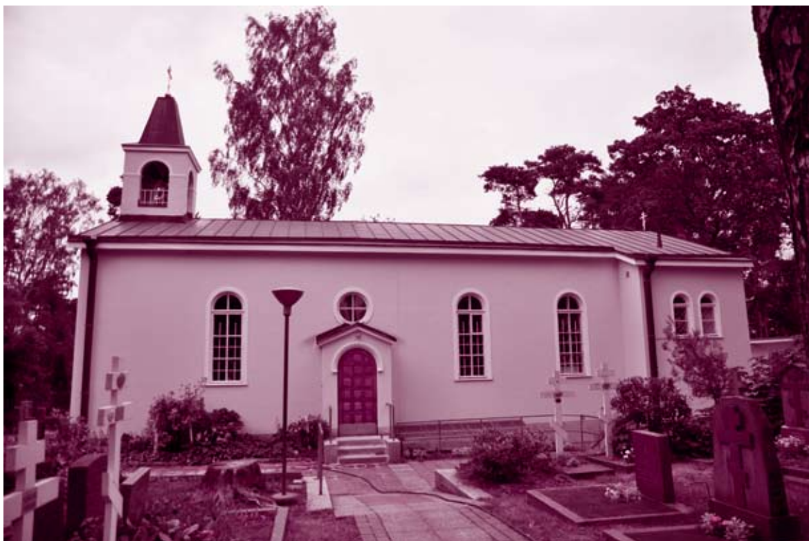
Никольский храм города Хельсинки