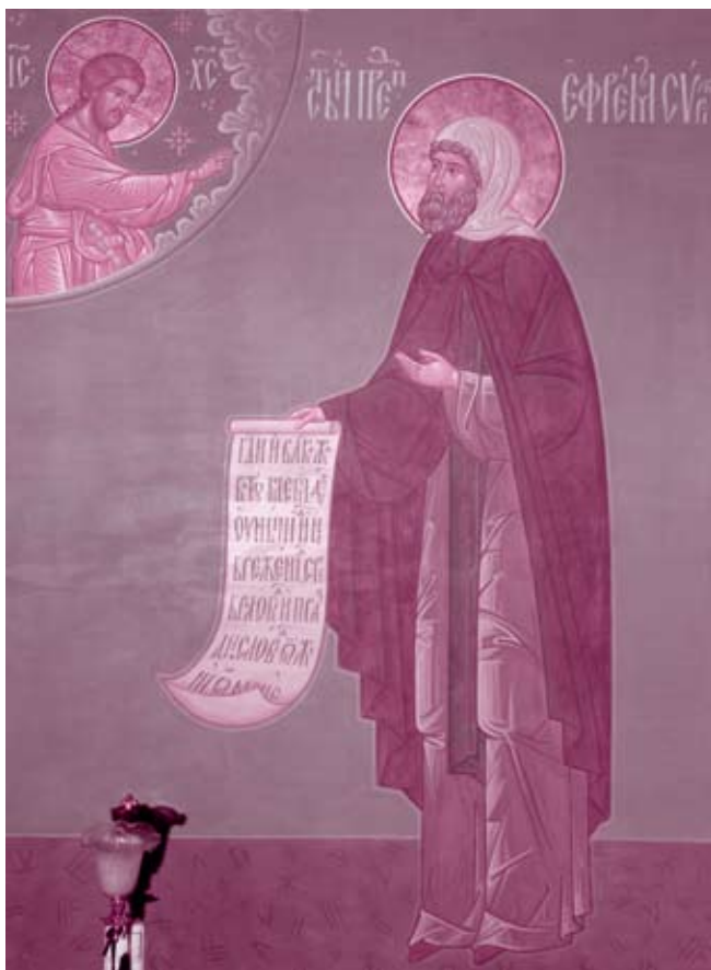
Преподобный Ефрем Сирин