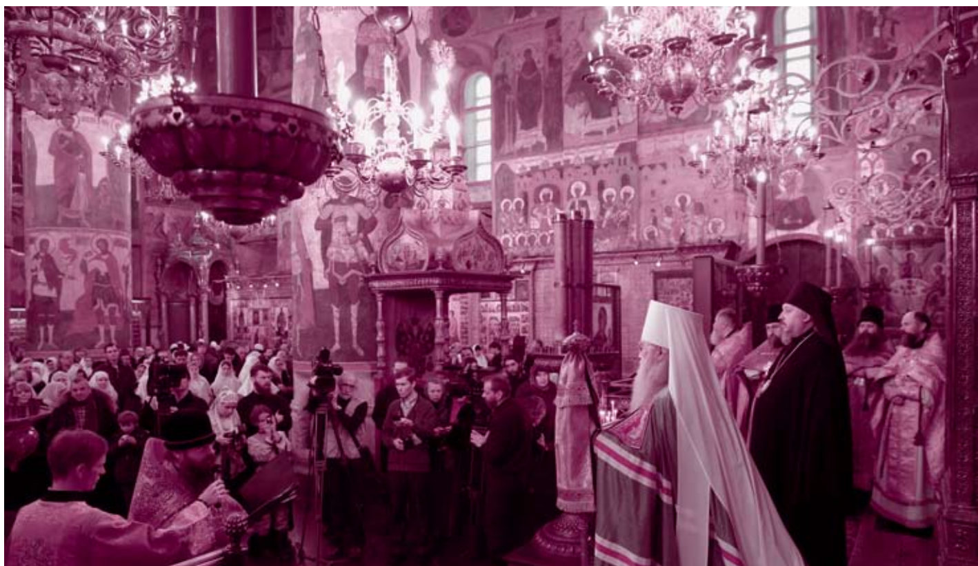
Приветственное слово священноигумена Иринарха. Успенский собор Московского Кремля. 12 января 2013 года

Таким событием и стала служба в сердце Русского Православия; в месте, освященном тысячами стоп святых угодников нашей земли, возносивших свои молитвы в стенах Успенского собора; в месте, и ныне освящаемом честными мощами русских Первосвятителей. Церковь в лице Святейшего Патриарха Кирилла и в Вашем лице, дорогой наш