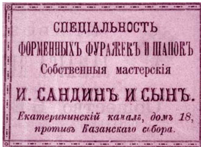
Рекламное объявление фирмы «И. Сандин и сын»