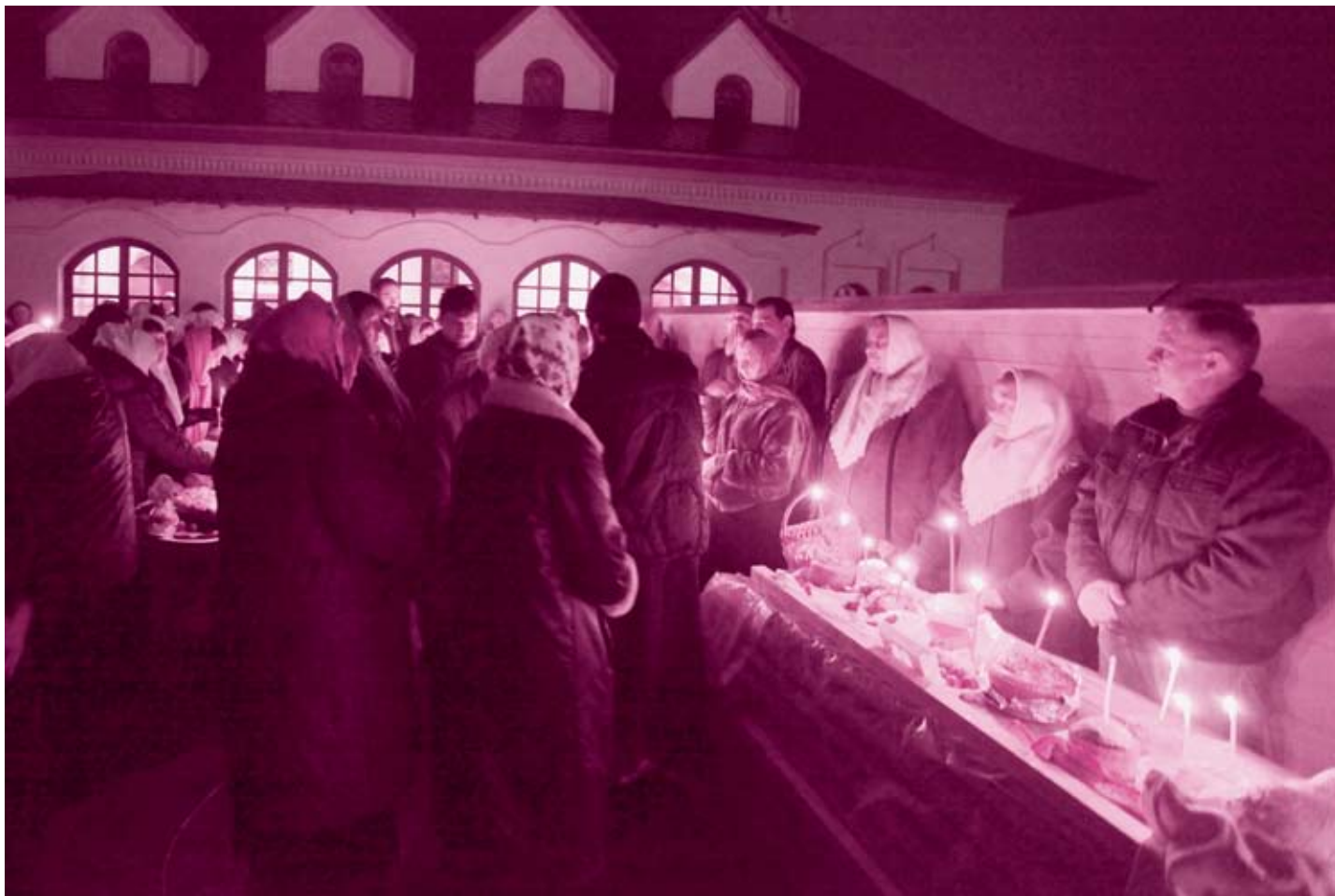
Освящение брашен в Пасхальную ночь

гела Михаила ежедневно совершались продолжительные службы, посвященные тому времени, когда Господь наш Иисус Христос пришел на вольные Страдания в Иеросалим, как и Сам Он предрек о Себе Своим ученикам.