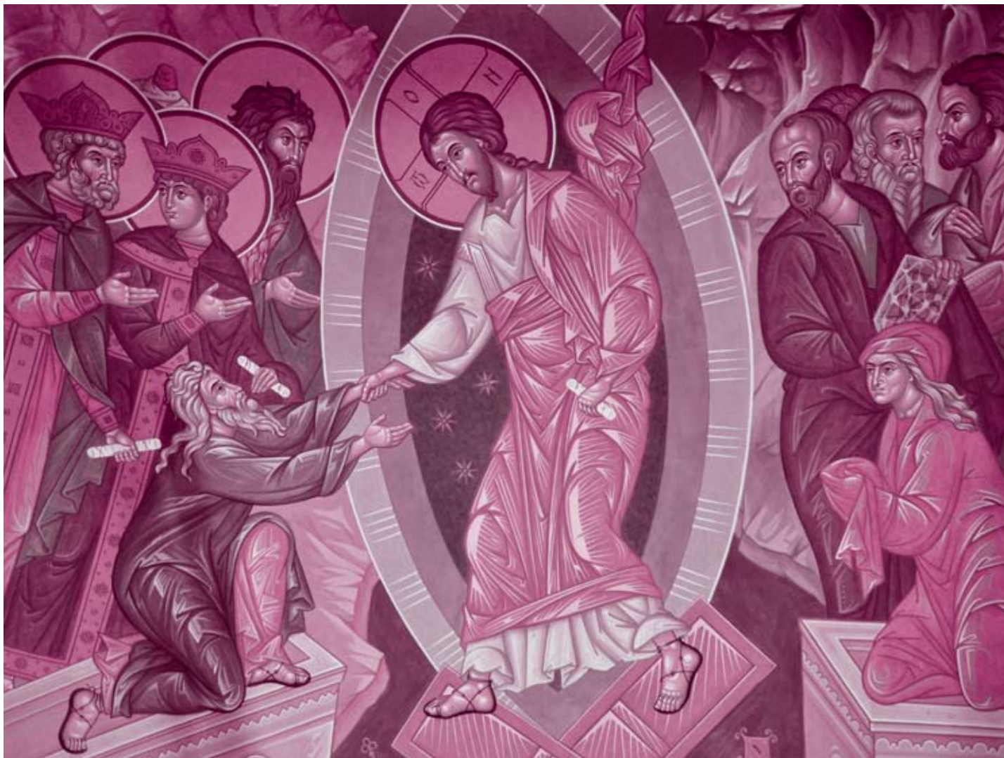
«Сошествие Господа нашего Иисуса Христа во ад» — фрагмент росписи свода древнего храма

нашего Иисуса Христа. В арке диаконских врат – ростовые изображения римских первосвятителей Селивестра и Мартина.