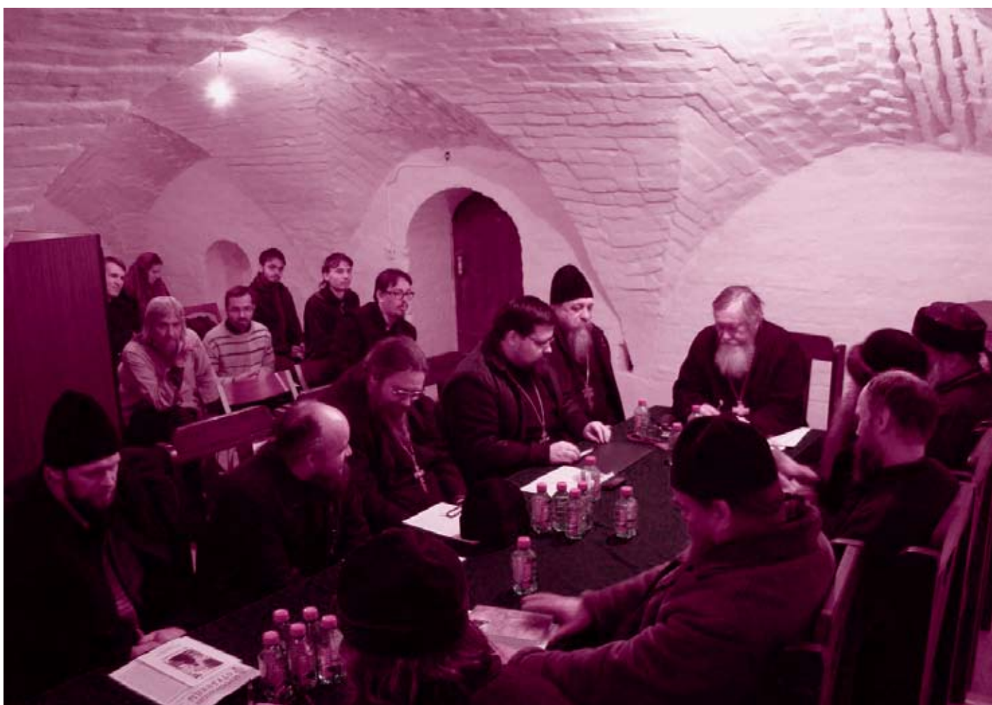
Круглый стол участников Рождественских образовательных чтений

нии съезда священник Симеон (Шлеев), впоследствии епископ Охтенский. Так, будущий священномученик выступил с докладами по всем вопросам, поднятым на съезде, и играл активную роль в их обсуждении. Отец Евгений также обратил внимание слушателей на ряд любопытных фактов: в частности, на то, что съезд посетил представитель Константинопольского патриарха архимандрит Иаков, а также на то, что в обсуждении поставлен-