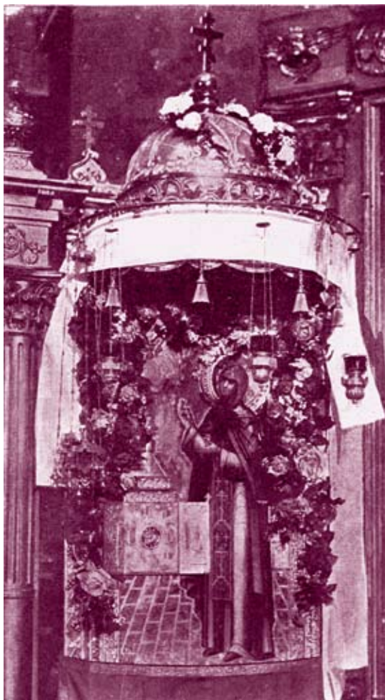
Икона Преподобной Анны Кашинской из Никольской единоверческой церкви Санкт-Петербурга