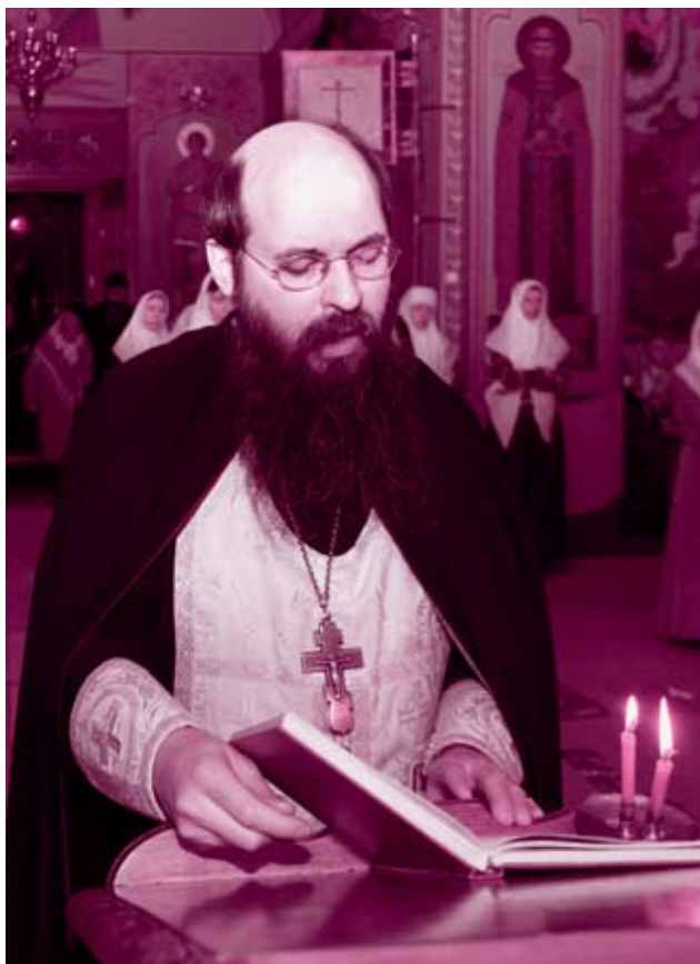
Священноигумен Иринарх читает канон Боготелесному погребению Спасителя

ПАСХА! Какое христианское сердце не вострепещет в радостном предвкушении, услышав