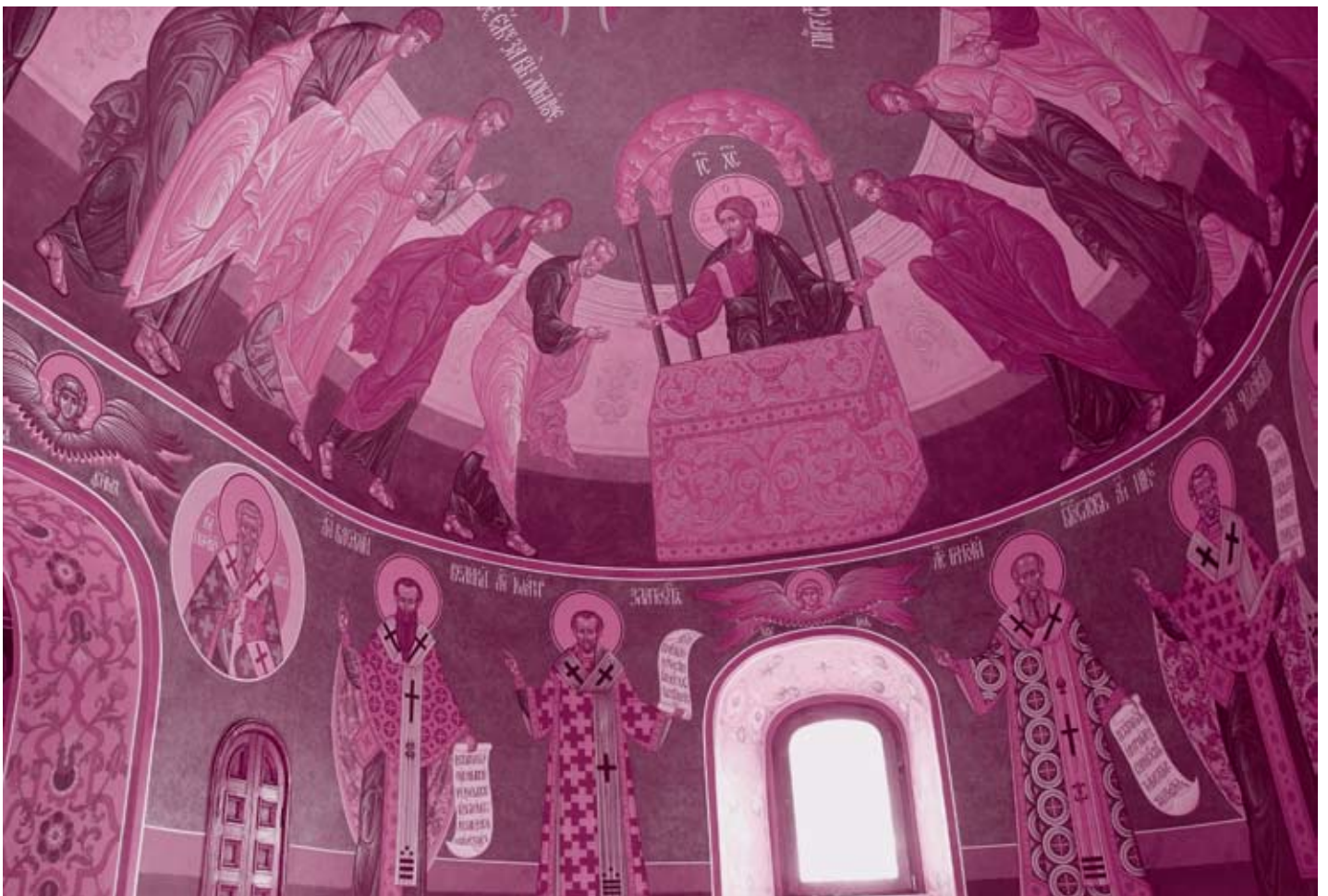
Роспись центральной части Михаило-Архангельского алтаря

Самый значительный объем работ выполнен в алтаре древнего храма. Здесь