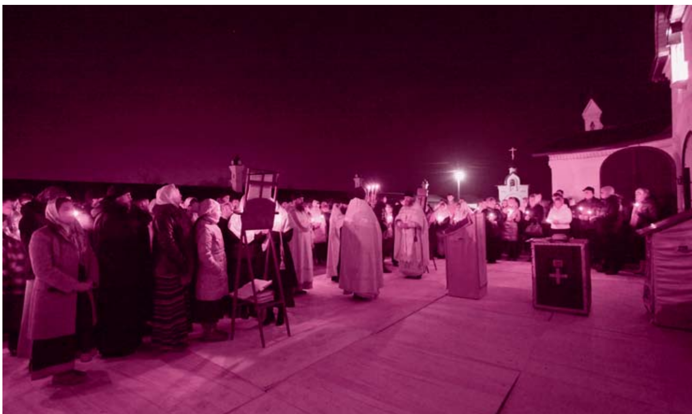
Пасхальная заутреня в Михайловской Слободе