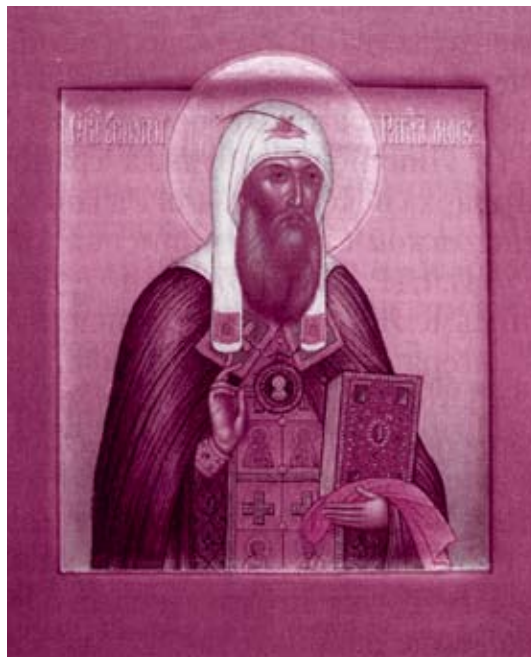
Икона священномученика Ермогена