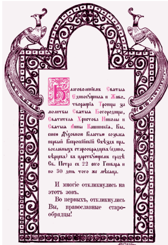
Заставка из книги «Первый Всероссийский съезд православных старообрядцев (единоверцев)»

4. Организация общего управления всем Единоверием: об особом епископе для единоверцев; об учреждении при Святейшем Синоде особой единоверческой комиссии.