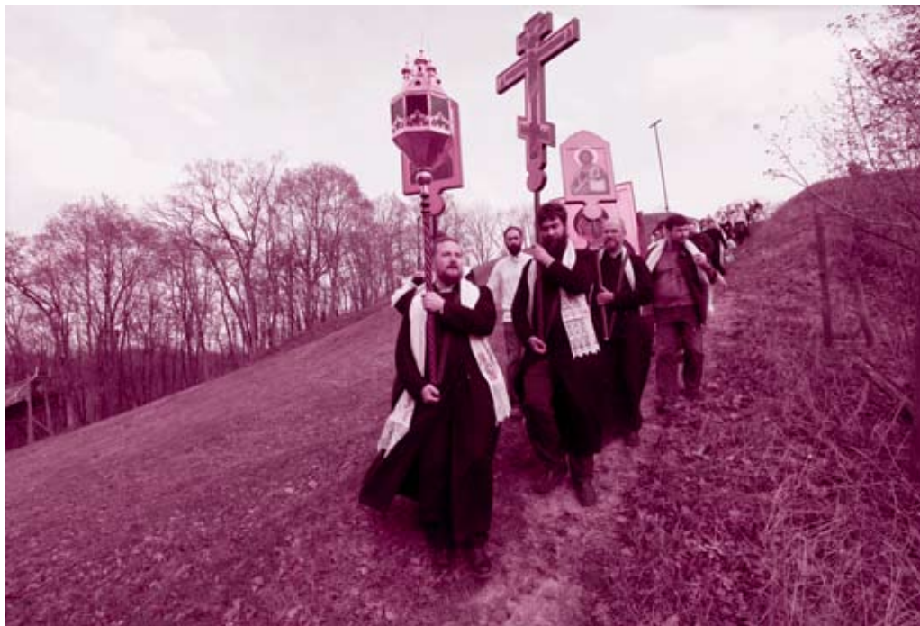
Крутой спуск с вершины Боровского кургана