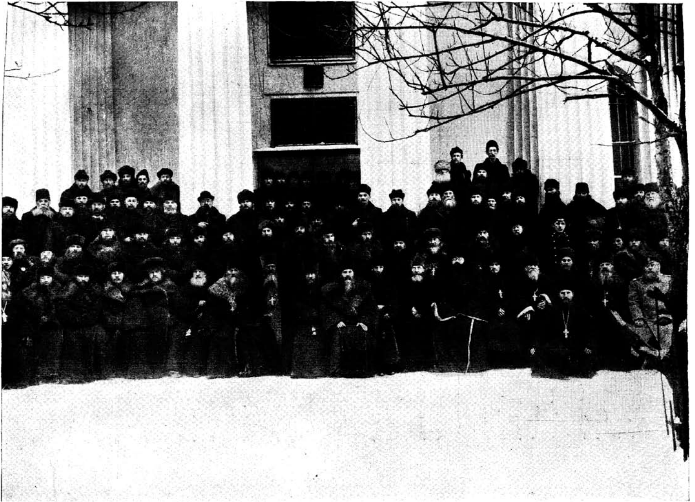
Делегаты Первого Всероссийского съезда православных старообрядцев (единоверцев)

вопросы о клятвах Соборов 1656 года и 1666–1667 годов, об учреждении "своего", служащего по древнему чину, живущего обычаями древней русской Церкви, епископа, об организации всей церковной жизни... Резолюции съезда касаются Православной Церкви, православного старообрядчества и всего старообрядчества.