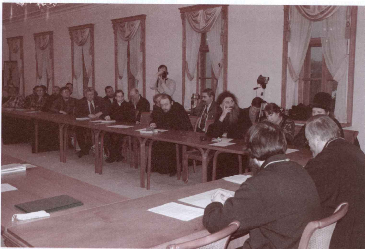
Работа секции «Старый обряд в жизни Русской Православной Церкви: прошлое и настоящее»