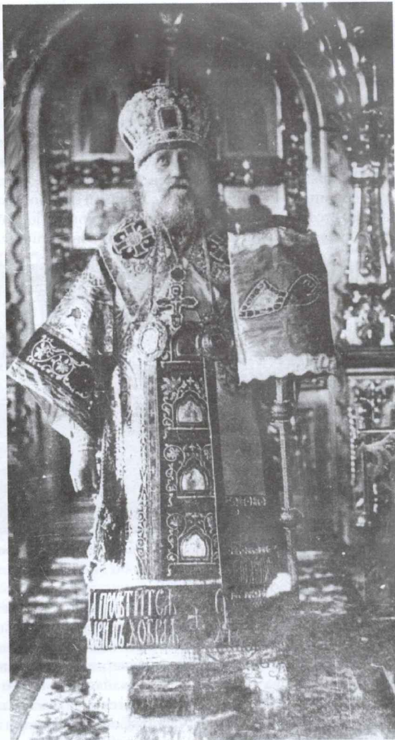
Святейший Патриарх Тихон

Во всяком случае самый плохой патриарх лучше самого хорошего Синода. Петр учредил Синод, увлеченный нездоровой политикой. При царе Алексее Михайловиче мы перестраивались на