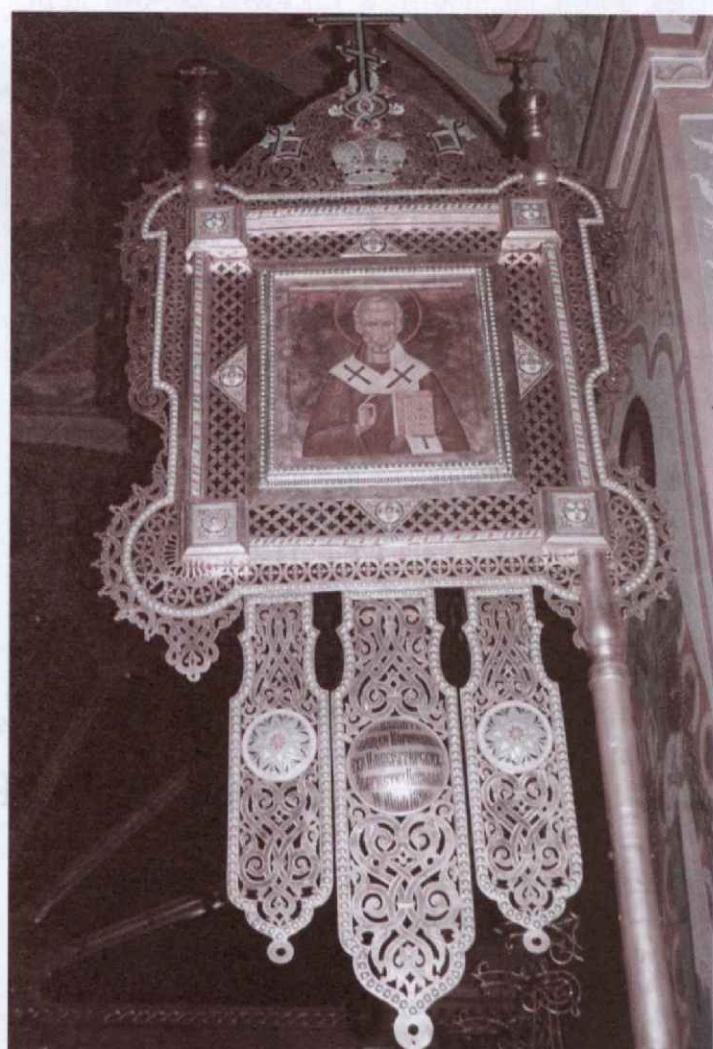
Восстановленные хоругви единоверческого храма Архангела Михаила