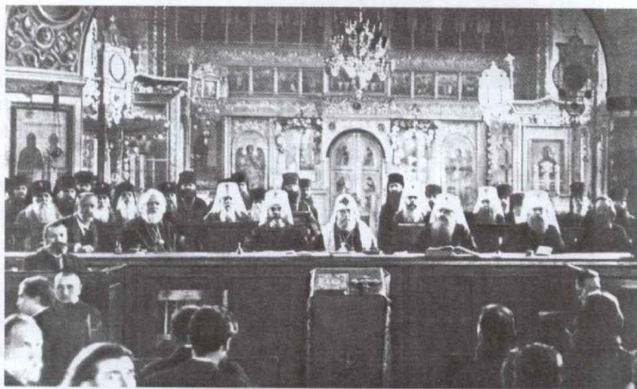
Заседание Освященного Собора Православной Российской Церкви 1917–1918 годов

Главный вопрос, который не сходил с уст участников Собора более двух месяцев, — это вопрос о восстановлении патриаршества