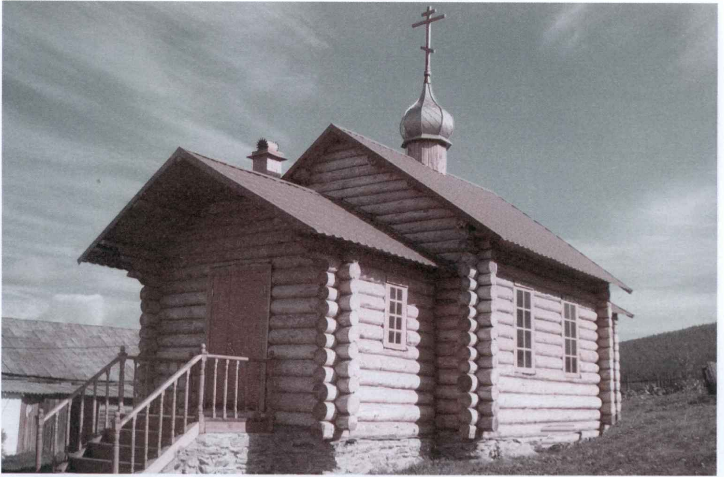
Храм Архангела Михаила в Верхнем Тагиле