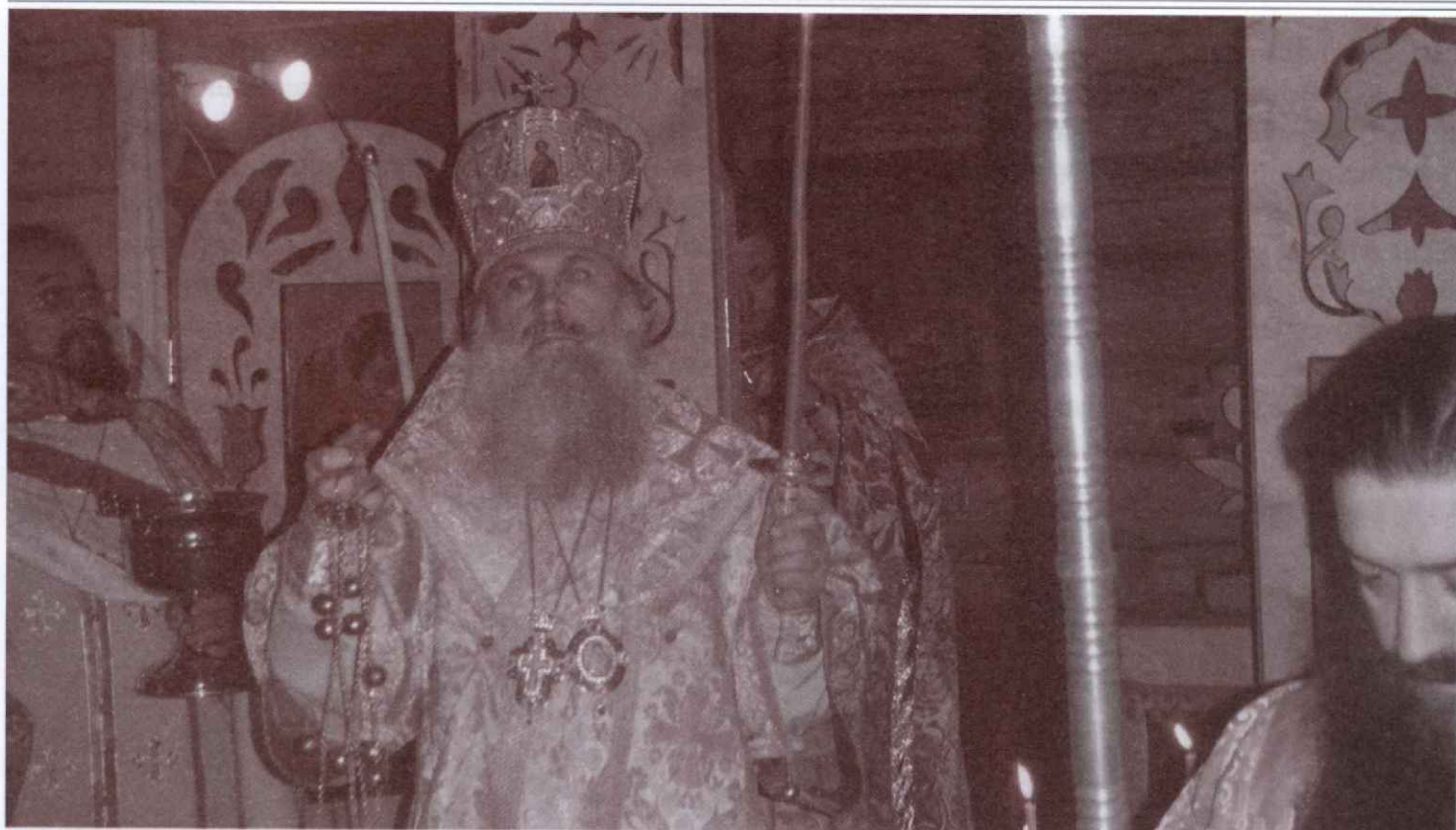
Архиепископ Викентий во время освящения единоверческого храма Архангела Михаила в Верхнем Тагиле