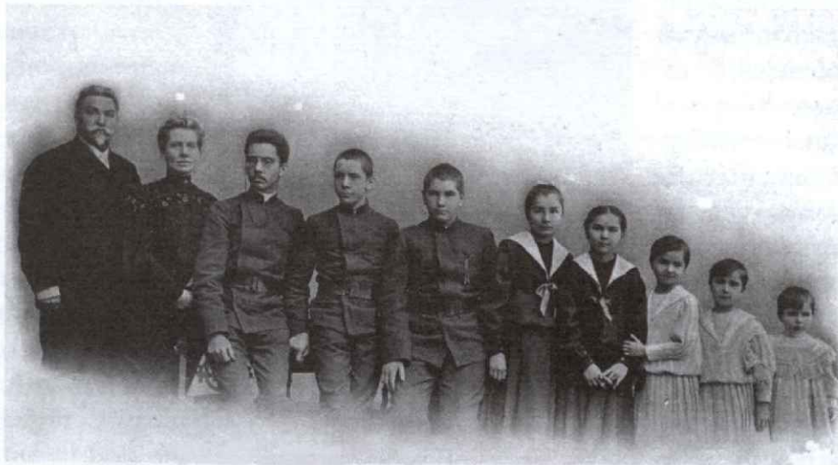
Фотография, названная В.И. Сафоновым «Органные трубы».

5) распространять славяноведение посредством издания книг, устройства музея, литературных вечеров и публичных лекций о славянстве; 6) учреждать премии на лучшие оригинальные славянские произведения и