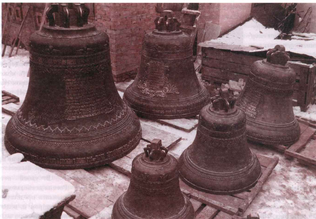
Колокола весом 3 200, 1 600, 820, 430 и 220 кг

По поясам двух других больших колоколов размещены надписи назидательного характера, подчеркивающие верность прихожан Михайло-Архангельского храма святоотеческому Преданию и древним уставам: