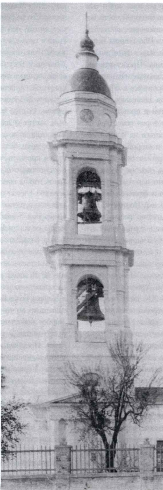
Вид колокольни храма Архангела Михаила в начале XX века

Почти 170 лет отделяют нас от тех достопамятных событий, но работы, ведущиеся по реставрации некогда великолепнейшей колокольни , заставляют нас вновь оглядываться в прошлое и находить параллели с тем, что происходит сегодня.