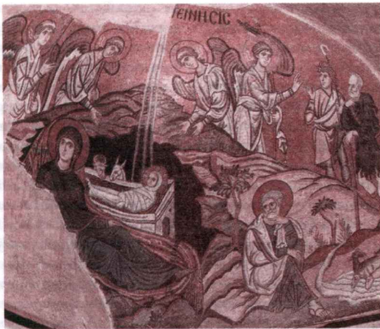
Рождества Христова. Мозаика. Византия. XI век

Д АВАЙТЕ почтим молчанием первое, особенное, Рождество Христово, свойственное Его Божеству. Более того, давайте положим себе за правило вообще не исследовать и не любопытствовать об этом с помощью наших понятий. Ибо что может вообразить себе ум там, где не были посредниками ни время, ни век, где образ не представим, где не было никакого зрителя и где нет никого, кто мог бы рассказать? Или как язык поможет разумению? Но был Отец, и Сын родился. Не спрашивай: когда? но просто оставь в стороне сам вопрос. Не исследуй, как? Ибо сам ответ невозможен. Ведь вопрос «когда» относится ко времени, а вопрос «как» неизбежно ведет к тому, чтобы представлять себе рождение телесным образом. Я могу представить доказательства из Священного Писания, что Сын рождается как Си-