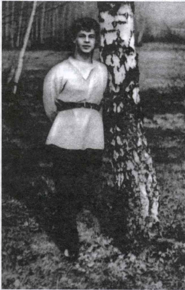
С. Есенин. Фотография 1918 года

дни, когда «Бог смешал все языки», когда все вчерашние патриоты готовы отречься и проклясть все то, что искони составляло «родину», книга эта как-то особенно становится радостной. Даже и боль ее, щемящая, как долгая заунывная русская песня, приятна сердцу, и думы ее в четких и образных строчках рождют милую памяти молитву, ту самую молитву, которую впервые шептали наши уста, едва научившись лепетать: «Отче наш, иже еси...»