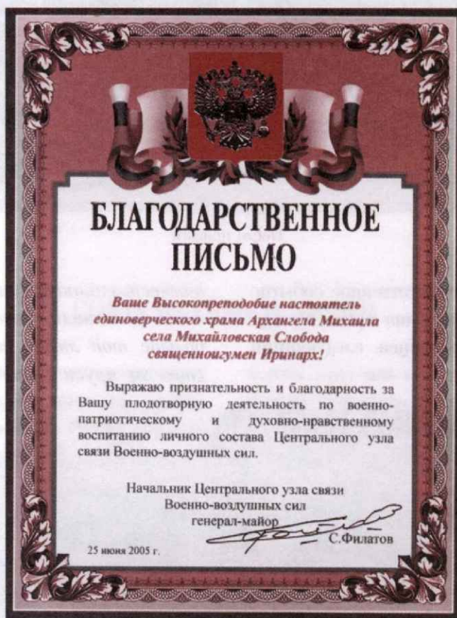
Благодарственное письмо священноигумену Принарху от командования войск связи ВВС

Уповая на Бога, остается желать дальнейшего еще более тесного сотрудничества между единоверческим храмом Архангела Михаила и ВЧ 55772.