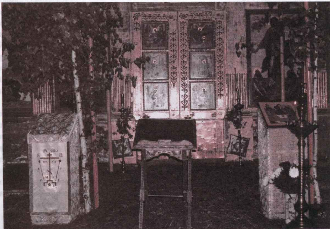
После всенощной на Троицу

Глаза держат в сторону. Церковь отстроена — Крест отзолоченный, На стенах росписи. Иконы написаны Баканом и возрою На дереве липовом, А в алтаре и того — кипарисовом. Здесь пение древнее От дедов и прадедов, Чин установленный От древних веков. Ризы парчевые На служителях истовых Грехи всем отпущены, Праотцы все помануты, Ход крестный свершается посолонь. Лампады зажженные. Свечи восковые. Ладан росный курится.