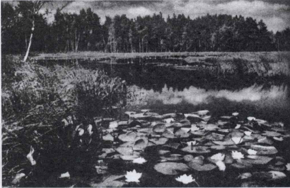
Мещера. Родные места поэта

Из разнообразных биографических данных складывается весьма примечательная картина. Ещё дед поэта по отцовской линии заслужил от своих односельчан прозвище «монах», кстати, прочно закрепившееся и за его потомством. Прожил он всего сорок два года, был трезвым и умным человеком, умел читать и писать и занимал в деревне почётный пост сельского старосты. А вышеозначенного прозвания удостоился за желание в юности своей уйти из мира в монастырь. Желанию этому не суждено было исполниться, но, видимо, оно исходило из самых глубин натуры, что и зафиксировало народное сознание в характерном прозвище, удивительным образом перешедшим «по наследству».