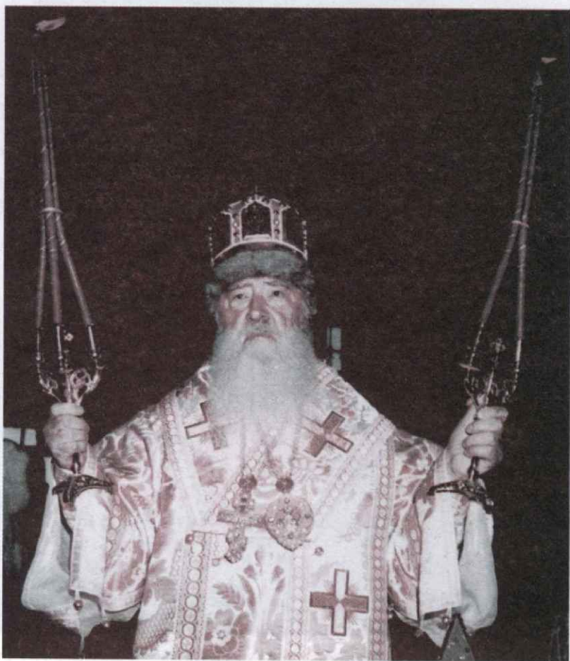
Исполня эти деснота

День, посвященный нам, Вашей верной пастве, навсегда останется вписанным золотыми буквами как в Летопись нашего храма, так и на скрижалях наших сердец. Вы могли убедиться в том, что единоверцы с трепетом и благоговением