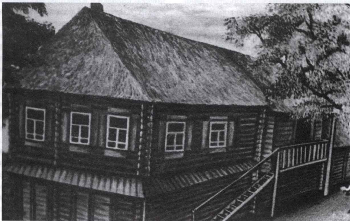
Дом, в котором родился С. Есенин

Недаром прадед За овса три меры Тебя к дьячку водил В заброшенной глуши Учить: «Достойно есть» И с «Отче» «Символ веры» Хорошего коня пасут Отборный корм Ему любви порука. И, самого себя Призвав на суд, Тому же самому Ты обучать стал внука.