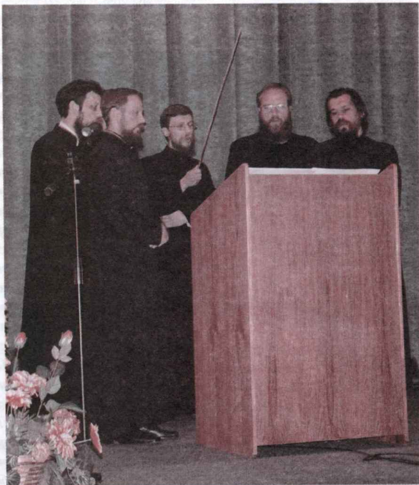
Выступление хора единоверческого храма Архангела Михаила на III Практическом съезде знаменного пения

При подготовке материала использована информация службы коммуникаций ОВЦС МП и сайта Общества любителей древнерусского пения