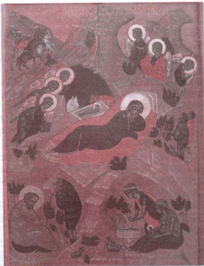
Икона Рождества Христова

Х РИСТОС рождается; славите! Христос с небес; сраштите! Христос на земли; возноситеся. Пойте Господеву вся земля (Пс. 95, 1)! И скажу обоим в совокупности: да возвеселятся небеса и радуется земля ради Небесного, потом Земного! Христос во плоти; с трепетом и радостью возвеселитесь, — с трепетом по причине греха, с радостью по причине надежды. Христос от Девы: сохраняйте девство, жены, чтобы стать вам матерями Христовыми! Кто не поклоняется Сущему от начала? Кто не прославляет Последнего? Опять рассеивается тьма, опять является свет; опять Египет наказан тьмой, опять Израиль озарен