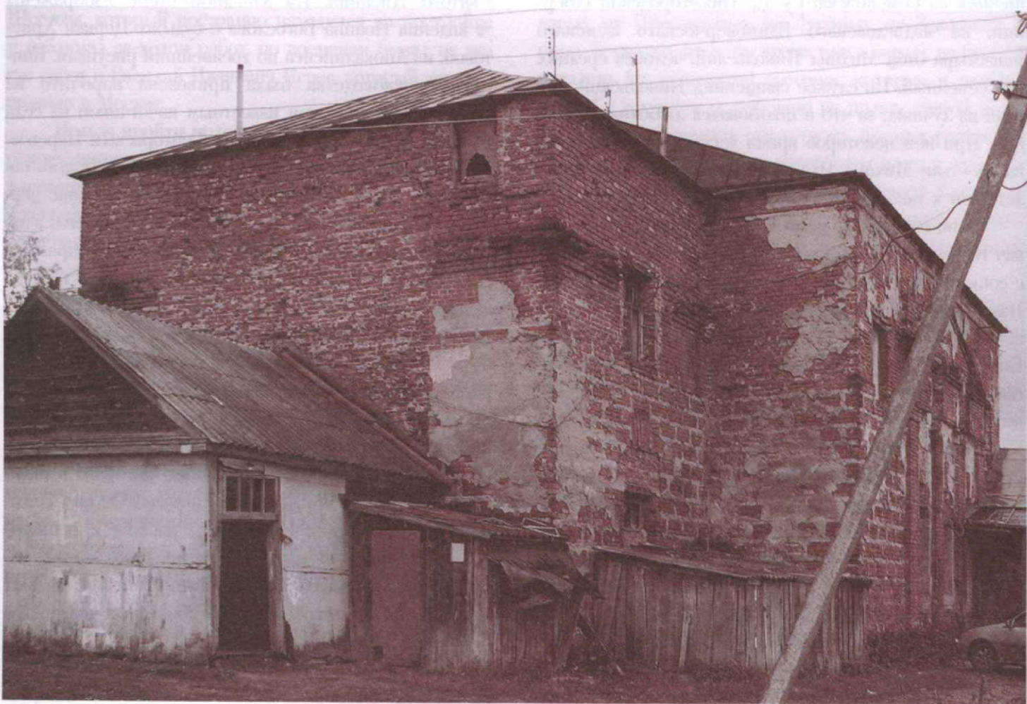
Здание бывшей богадельни в Большом Мурашкино