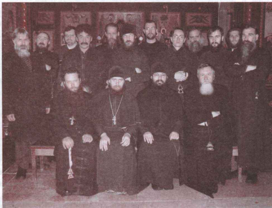
Духовенство, причт храма Архангела Михаила и гости

После окончания Богослужения за праздничной трапезой было сказано много теплых приветственных слов, посвященных торжеству Небесных Сил