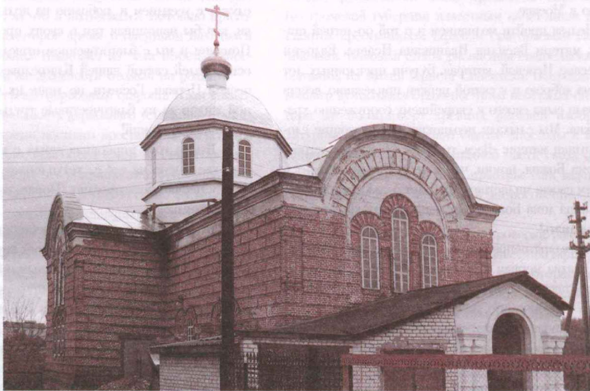
Покровский единоверческий храм (ныне принадлежащий Русской Православной Старообрядческой Церкви) села Большое Мурашкино