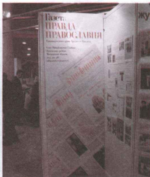
Стенд «Правды Православия» на выставке православных СМИ