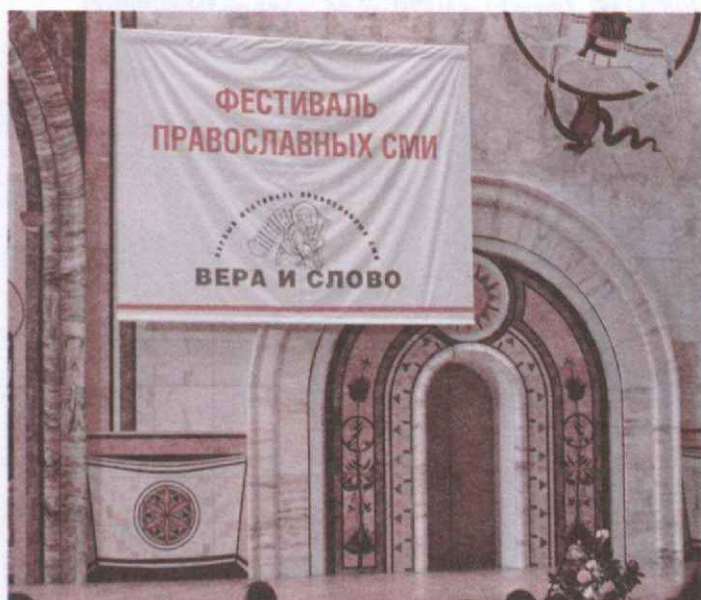
Флаг фестиваля православных СМИ «Вера и Слово»