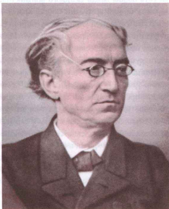
Поэт Ф. И. Тютчев