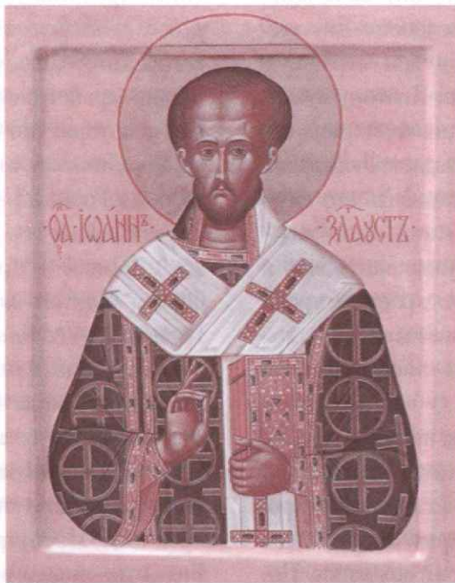
Святитель Иоанн Златоуст

крывать их с точностью и великою осмотрительностью и знать, что нужно произносить и что держать внутри. Ибо не столь многие, — говорит Премудрый, — пали от меча, сколько от языка (Сир., 22: 21); и Христос говорит: не входящее во уста, сквернит человека, но исходящее из уст, то сквернит человека (Мф., 15: 11); и еще другой: устам твоим сотвори дверь и затвори (Сир., 22: 29).