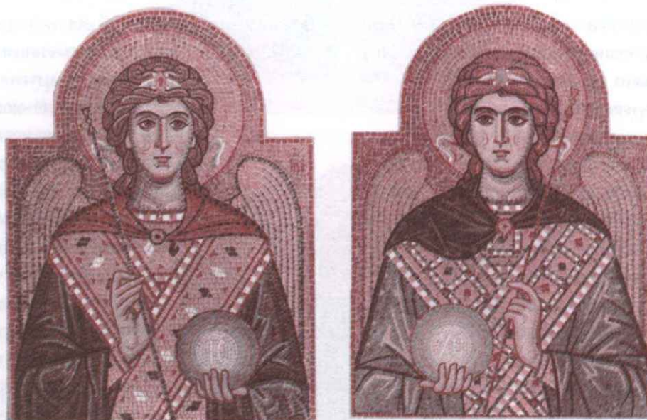
Мозаичные иконы Архангелов Михаила и Гавриила, установленные с внутренней стороны Святых Врат единоверческого храма Архангела Михаила

В КОНЦЕ сентября значительно преобразились Святые Врата единоверческого храма Архангела Михаила. С их внутренней стороны появились два