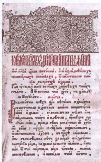
Первая страница «Книги о вере единой истинной и православной» архимандрита Захарии Копыстенского

Третий крупнейший антиуниатский полемист — афонский инок Иоанн Вишенский