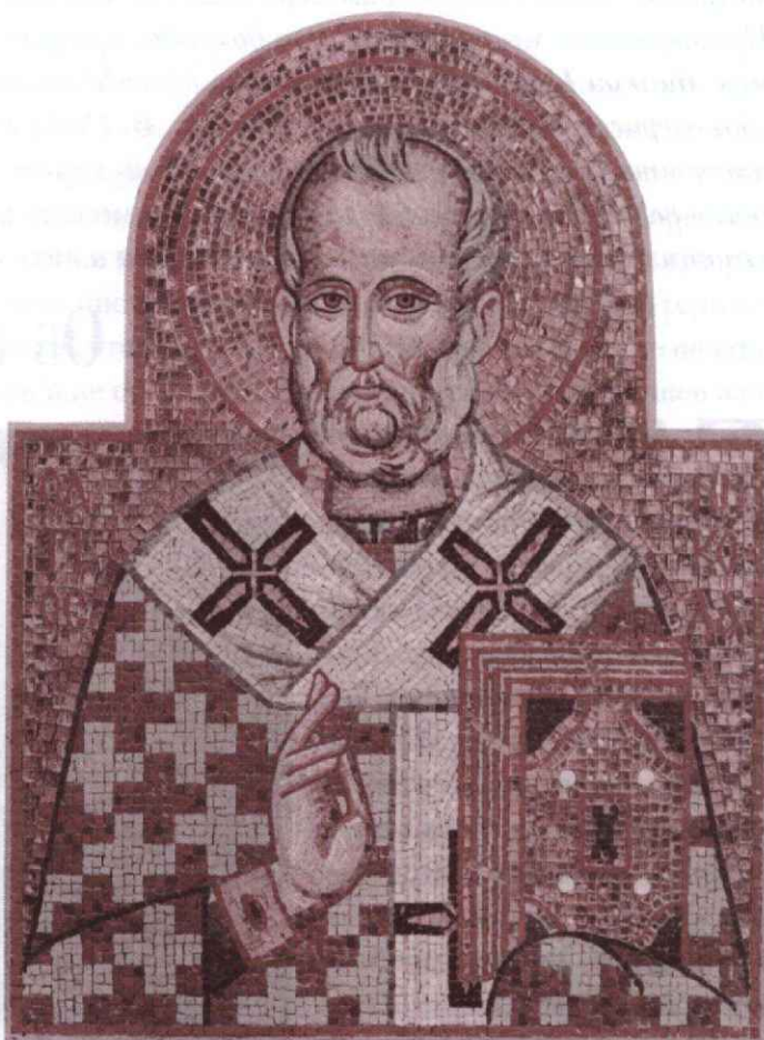
Св. Никола Чудотворец.

Икона на Святых вратах храма Архангела Михаила