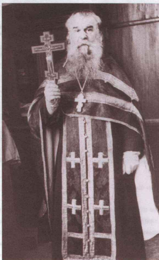
Священномученик Иоанн Бороздин

и целые общества и Высочайше учрежденный Комитет о русской иконописи стараются поддержать его на той высоте.