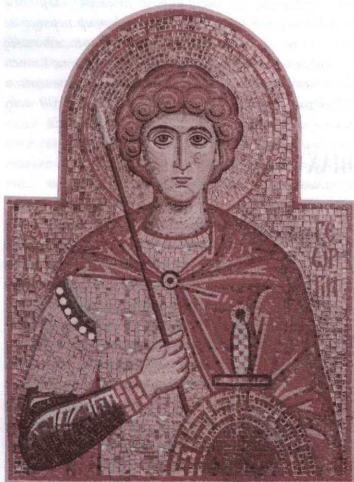
Св. великомученик Георгий.

При выполнении работ мастерами была использована смальта из Италии, а также смальта, изготовленная российскими производителями из Санкт-Петербурга и Подмосковья.