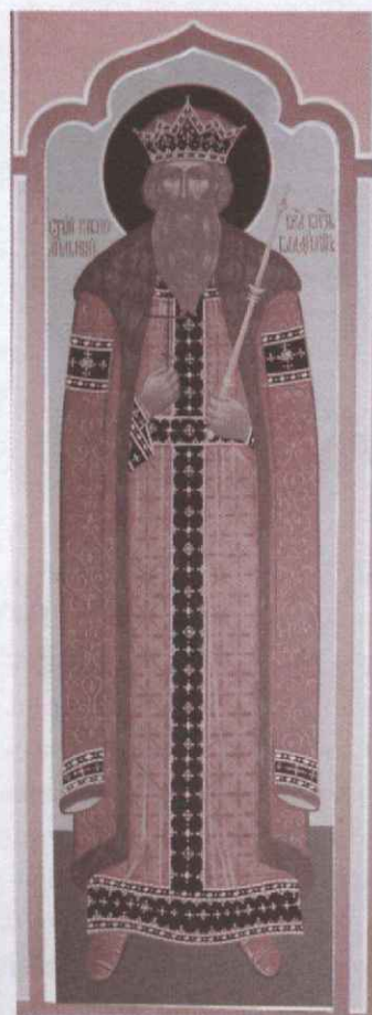
Св. великий равноапостол князь Владимир

В прошлом месяце в храме Архангела Михаила было два Престольных праздника: 23 апреля / 6 мая — святого славного великомученика Георгия Победоносца, а 9/22 мая — иже во святых отца нашего Николая, архиепископа Мир Ликийских Чудотворца. Знаменательно, что в мае на Святые Врата перед храмом Архангела Михаила были воздвигнуты святые иконы этих высокопочитаемых в нашем храме святых угодников Божиих.