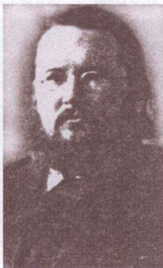
Князь А.А. Ухтомский.

Отнимите у старообрядческого храма общий уставный характер богослужения,