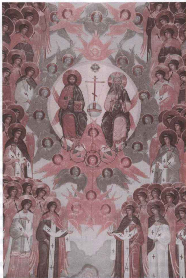
Композиция «Живоначная Троица». Свод центральной части зимнего храма Архангела Михаила