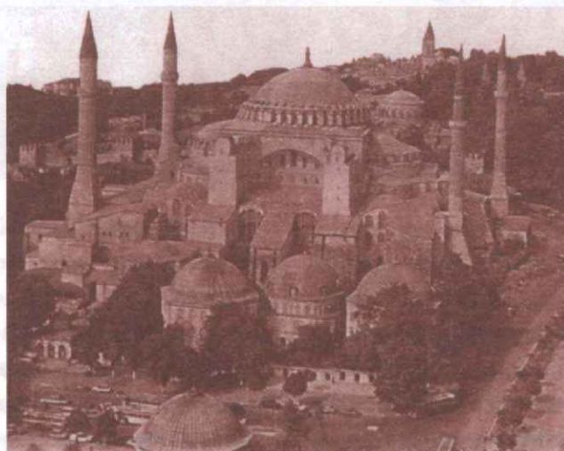
Собор Святой Софии, построенный в Константинополе императором Юстинианом в середине VI века.

в котором являются так называемые антропологические вопросы, то есть вопросы об отношении человека, причем, прежде всего, индивидуального, то есть падшего, человека, к Богу, задаваемые в ходе линейно направленной истории. Если западный чисто рационалистический подход к духовным вопросам доводить до крайности (о чем будет сказано позже), то всякое творчество человека, который сам есть результат творения ex nihilo , «из ничего» (в соответствии во второй книгой Маккавейской; Мк., 2, 7, 28) есть каинизм, строитель-