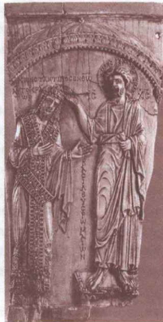
Господь Иисус Христос венчает императора Константина VII. Слоновая кость, Византия. Середина X века

Еще в IV веке Запад достаточно произвольно выделяет отдельные стороны домостроительства спасения из его единого целого. Согласно св. Апостолу Павлу, спасение устроится Богом для всего мира, всей твари, «Чаяние бо твари, откровение сынов Бо-