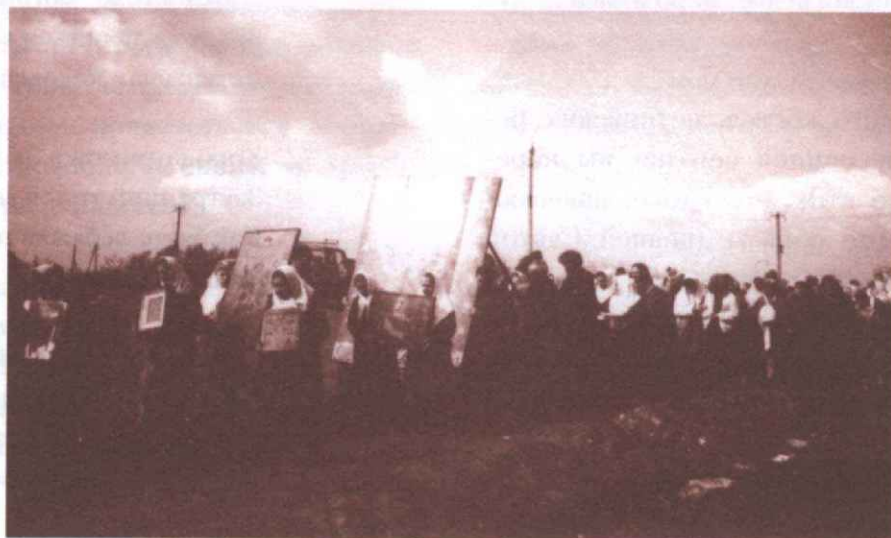
Крестный ход в Неделю Жен-Мироносиц 15/29 апреля 1990 года

Приглашаем всех прихожан храма Архангела Михаила принять участие в Крестном Ходе.