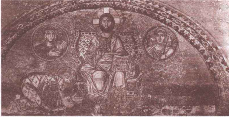
Император Лев VI перед Христом. Мозаика над западным входом в собор св. Софии Константинопольской