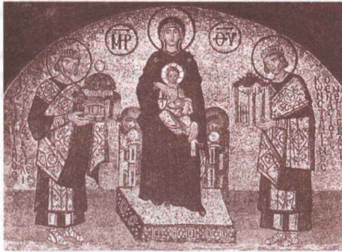
Императоры Константин и Юстиниан перед Пресвятой Богородицей. Мозаика над южным входом собора Св. Софии

образ христианства (на самом деле ложный) как своеобразной демократии и даже охлократии ( власть толпы, по Аристотелю — крайняя форма вырождения демократии ). Впрочем, говоря современным языком, вполне «управляемой». «Управление» взяли на себя полутайные структуры, уходившие в глубину языческой эпохи. Так, за несколько веков до Рождества Христова в Риме фактически управляла так называемая Curia Roma — «Рим-