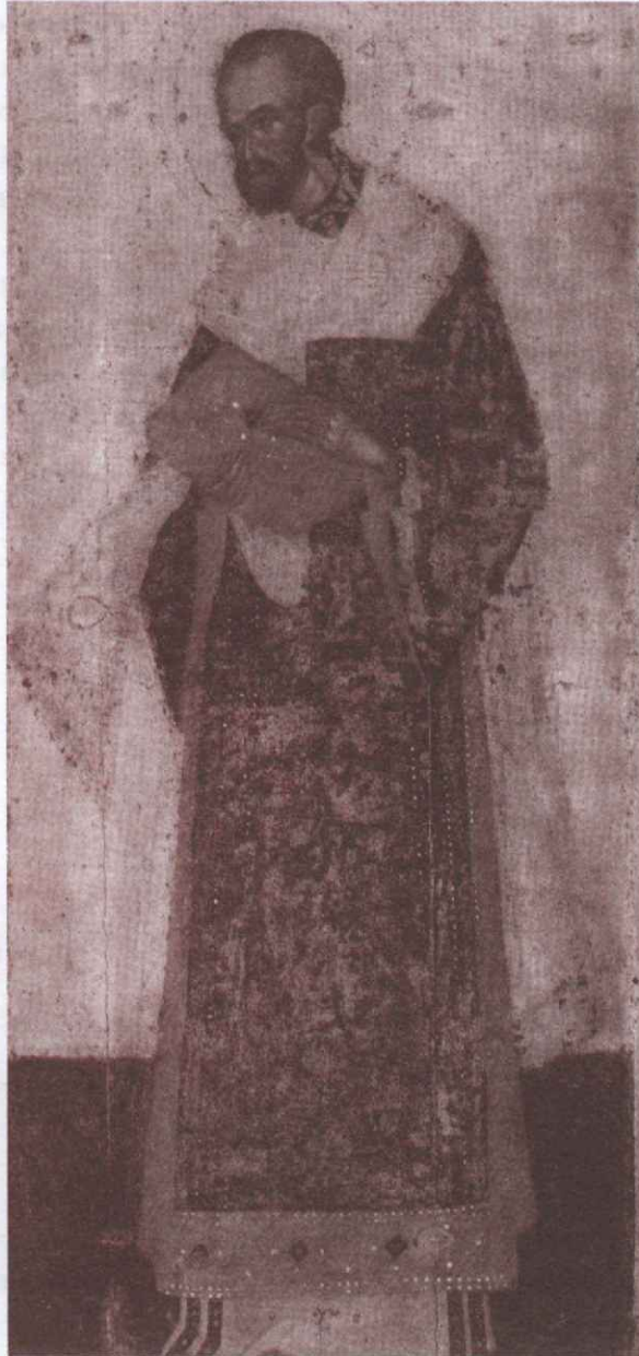
Святитель Иоанн Златоуст.

несколько не повредит ему по хорошему свойству самого дня, и таким образом он в том и в другом случае будет терять свое спасение. Зная это, мы должны избегать козней дьявола, исторгать из души такое убеждение, не наблюдать дней, не пренебрегать одним днем и не привязываться к другому. Лукавый демон ухищряется против нас таким образом не только для того, чтобы свергнуть нас в нерадение, но и чтобы